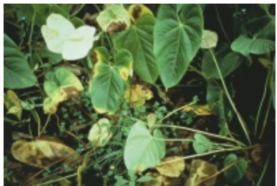
火鶴花園罹患細菌性葉枯病，嚴重時整園將廢棄

另外建議花農的是，先從健康的花區開始工作，以避免將病菌從病區攜帶至健康區內，尤其是切花時，更需跳開