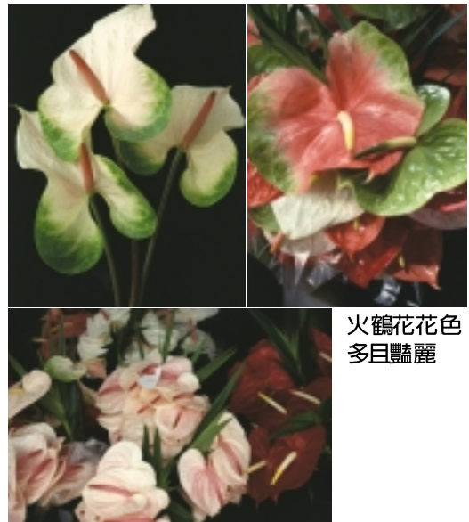
火鶴花花色多且豔麗

我國方面，防檢局為了解決火鶴花可能發生線蟲及葉枯病的問題，推動「火鶴花健康種苗檢測制度」，集合相關人員通力合作，規定火鶴花種苗販賣或遷移都必須經過檢測，確認種苗不帶所規定的病原菌方能販售。這些檢測工作則由政府相關機構代為檢測，此舉就是政府單位為了替花農把關，防止病原菌