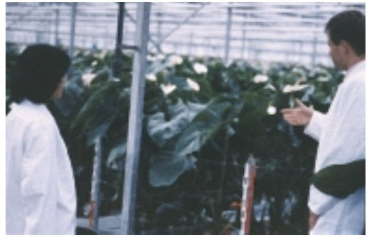
每畦種植的火鶴花，最好使用專屬的刀剪來切花

花農要自己判斷現在及未來市場需求的色系品種，估算合理的成本之後，再尋求適合自己的栽培方式，並積極獲