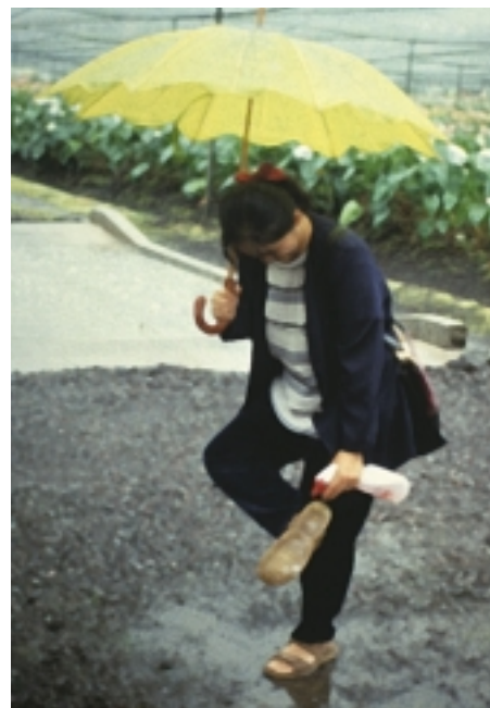
進入園內之前需更換乾淨的鞋子或鞋底噴消毒劑

筆者進行室內及田間藥劑試驗篩選發現，嘉賜銅 (83.3% W.P.)、四環黴素 (30.3% S.P.) 及鏈四環黴素 (10% S.P.) 等藥劑對葉枯病菌的生長及病害發生具有抑制作用，但這些藥劑在田間實際防治效果受許多因子影響，花農需小心使