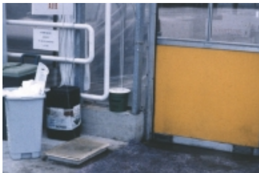
入園前雙腳鞋底需踩踏沾有消毒劑的墊子

機，切勿連續或長期使用同一類的藥劑。在進行葉枯病藥劑篩選試驗時發現，部份的葉枯病菌株對鏈黴素具有抗性，對銅劑也具有忍受性。因此，在施藥之前，需先確定本病菌是否已產生抗藥性，再選擇適當藥劑噴施，否則形同浪費。而且施藥之前也必需先清除園內病株，否則病菌會隨著噴藥的水而傳播。