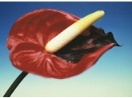
火鶴花細菌性 葉枯病在苞片 上之病徵

消毒劑，或換上乾淨的鞋子，帶入園內的農具及配備必需清潔；避免在園內或園區周圍種植或帶入本病菌的寄主植物等。