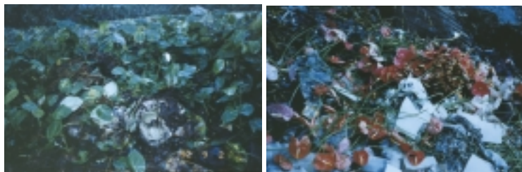
勿將病株丟棄在園內，以避免再次感染健株

病株，避免病菌經枝剪傳播，因為切花用具是本病害的傳播媒介。因此，切花時務必剪完健區再剪病區，工具的選擇最好是輕巧耐腐蝕的容器，並配於腰間，而且於容器內放置