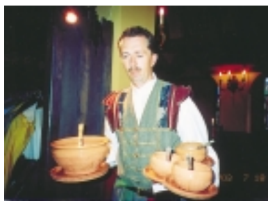
著古裝的餐廳服務人員

大部份的匈牙利人相信，他們的祖先是來自亞洲，從鈔票上找得到MAGYAR字樣，得以證明，這MAGYAR正是祖先馬札爾之名，承襲亞洲人種的血液，論及姓名，至今匈牙利人還是把姓放在前面，名放在後面，這和歐洲其他國家，把名放在前面，姓放在後面，是大不相同的。