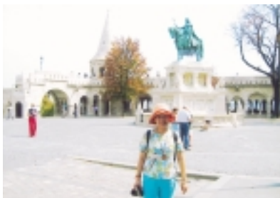
傳說漁夫堡是早期魚穫市場，後來成為漁夫看守城市要塞

對觀光客而言，到了布達城，總是從漁夫堡開始起步，也就是說，站在高處的這岸看那岸，風景最為寬闊，然後，順著馬堤亞斯教堂、黑死病紀念柱、舊皇宮、國家藝廊、歷史博物館……，一路參觀下去，這些建築物，讓人難以感受到匈牙利建國千年的風華，因為除了教堂，其餘的建築年代竟都在百年上下，有些甚至是在二次大戰後才修補