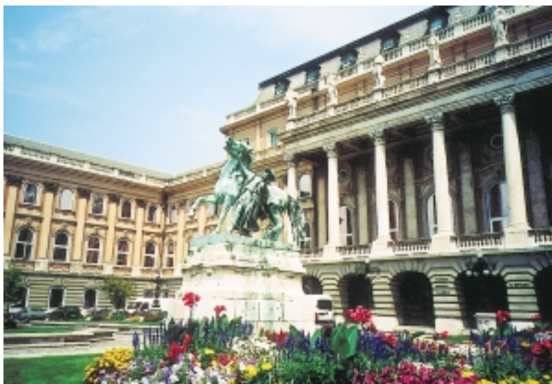
舊皇宮前的雕像有馬扎爾人丰采