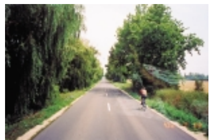
匈牙利是以農立國的國家（鄉間小路旁均是農田）