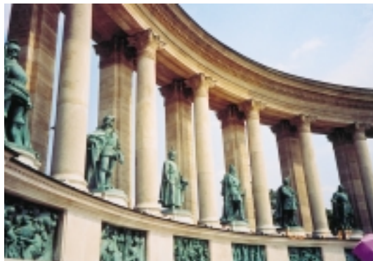
英雄廣場圍牆上有民族英雄等銅像

名符其實的廣，這麼大的廣場，不缺的是霸氣，好里佳在的是，場中央立在36公尺高柱的是天使，非人類，既然有天使俯瞰，大地就帶上幾份溫柔，因此廣場週圍牆上的那14尊民族英雄等大