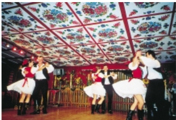
據說舞台上的表演者，吉普賽人佔多數

族音樂和舞蹈表演，據說舞台上的那些人，吉普賽人佔多數，表演者總是這麼樣的陶醉，像我這樣的音樂白癡，也是有點感動的。