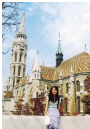
馬堤亞斯教堂是紀念十五世紀讓匈牙利成為強國的君王