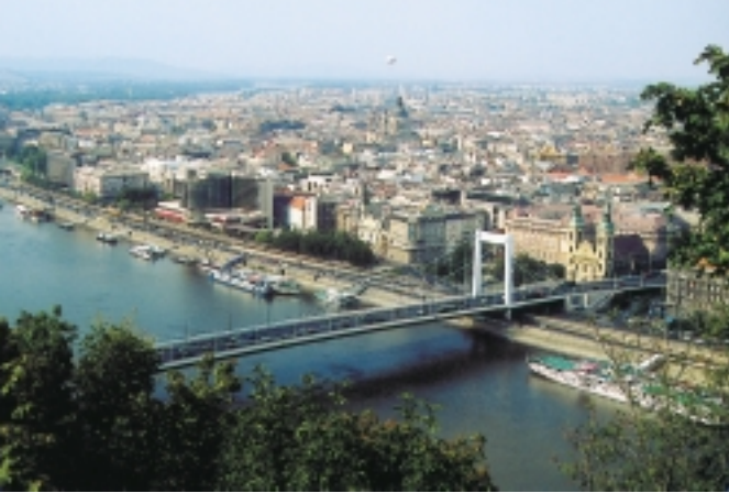
從伊莉莎白橋畫出半徑300公尺，是佩斯城老市區

由此直通的往城堡區走，是要過伊莉莎白橋，所以對有地標特質的鎖鏈橋，只能驚鴻一瞥。