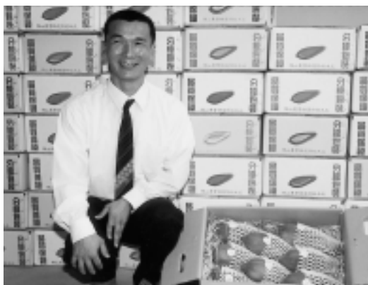
旗山示範班是該鎮紅晶果品牌主要來源