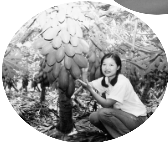
全部示範班採網室栽培