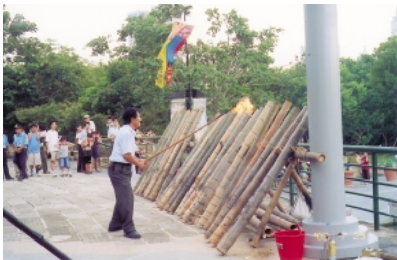
台中科博館植物園慶祝4週年年慶、點燃「竹禮炮」，照樣震天價響，揭開「花果節」系列活動序幕

爲了慶祝植物園滿4週年的日子，台中市國立自然科學博物館，曾舉「四四如意花果節系列活動」，用古老的「竹禮炮」揭開序幕，讓大家由衷讚美先民的智慧與發明。