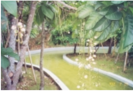
夜間開花的「穗花棋盤腳」散發香味