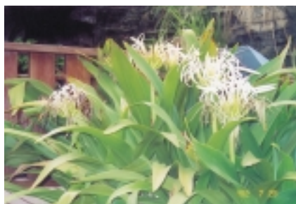
另一位解說員說：夜間很迷人，這是夜間會散發香氣的「文殊蘭」