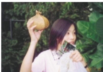
解說員很專業，遇不開花的植物，她會展示自己蒐集的標本作補充