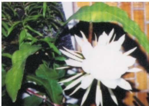
「曇花」一現，讓您在夜間享用短暫的香、柔、美

且大，雄蕊數量多，而雌花比雄蕊長，開花時有濃濃的香氣。蘭嶼的原住民認為：她在夜晚開花，不吉祥；於是，視為「魔鬼花」。