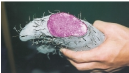
紫色塊狀的山藥品種

山藥「種薯」發芽後，第二個月為第一次追肥，第三個月為第二次追肥，施肥後即培土。名間鄉的山藥大多採有機質肥料栽培。每分地整地後即以400~500公斤有機質肥料混合，做為基肥。山藥穴管栽培方法是將「種薯」平放於土中，而不是深埋穴管，「種薯」在穴管內生長初期需施較多氮肥。