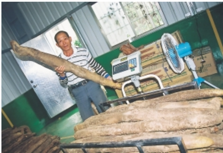
山藥集貨場，統一分級包裝，行銷至全省各地

山藥施肥三要素推薦量：每公頃施肥20公噸時，配合施肥三要素為：氮8~10公噸、磷5~7公噸、鉀11~13公噸，視當地土壤及山藥生長情形而做調整。