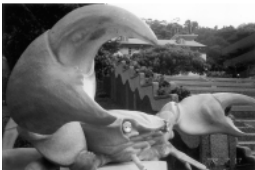
北關「螃蟹博物館」前的螃蟹造景