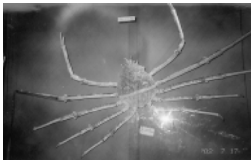
北關「螃蟹博物館」中最大的螃蟹