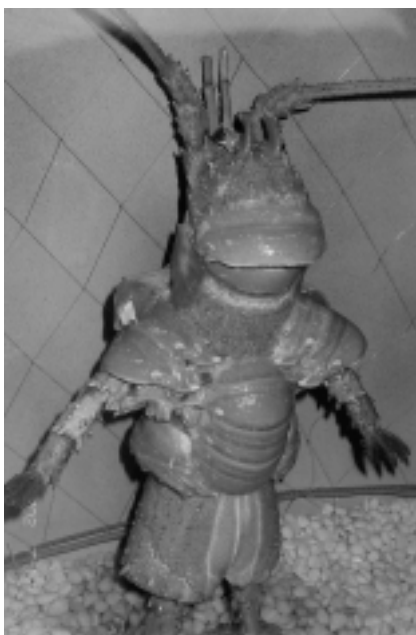
樣子特別的甲殼動物標本

除了可食用的螃蟹以外，當然也不乏具有毒性，能致人於死地的螃蟹，不過毒蟹不像毒蛇具有毒腺，被鉗夾傷手指就中毒，這種毒蟹的毒素，是來自牠所吃的食物，如有毒的藻類，積存在身體的各部位組織中，所以人們吃進肚子裡才會中毒。目