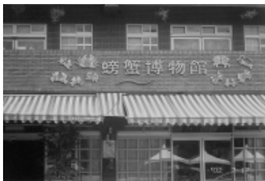
北關農場的「螃蟹博物館」