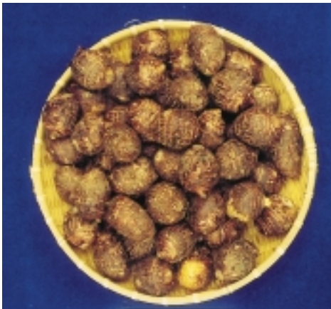
「高雄2號」子芋外形美觀、整齊呈短球型

民所栽培之子芋以赤芽芋及其他不明系統居多，長久以來並未經選拔及純化，故田間外表型性狀混雜，子芋球莖外觀整齊度差，且品質及產量均不穩定，為此，高雄場自民國79年起，進行子芋用品種改良工作。芋為無性繁殖作物，開花不易，開花時雌雄蕊同花異熟，授粉常因不正常減數分裂而不稔性甚高，雜交困難。故育種方法為自各地蒐集地方品系，加以純化及選拔。為提昇產品品質及競爭力，訂定三項選育目標：