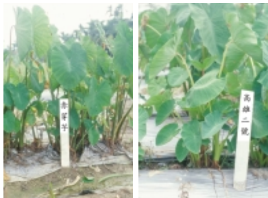
新品系高選系26號（高雄2號）及對照品種（赤芽芋）植株外觀比較