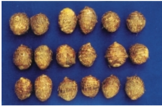
高雄2號子芋長、寬比例均勻