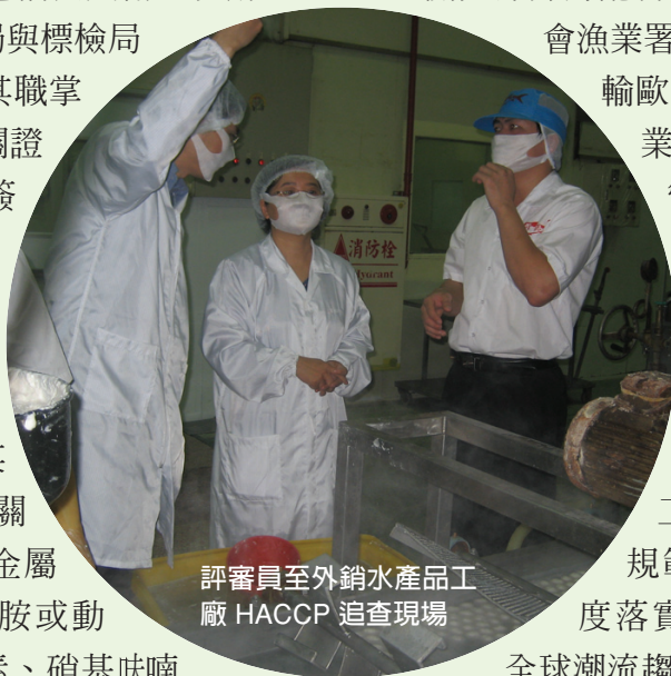
評審員至外銷水產品工廠 HACCP 追查現場

全球潮流趨勢，期盼我全國與食品生產鏈相關之產、官、學界體認此全球趨勢，各自扮好在食品生產鏈之角色及落實相關衛生安全管理工作。