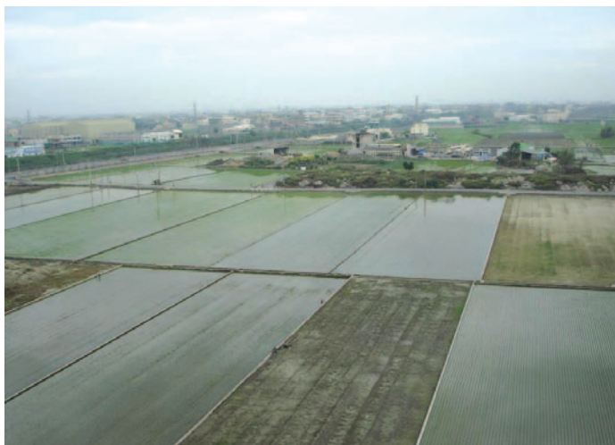
農地重劃後坵塊面積擴大及方整 (彰化縣鹿港鎮南勢區)

依據 94 年行政院農業委員會（以下簡稱農委會）編印「農業統計年報」實際作為農作物生產之耕地，台灣省加北高 2 市約有 833,176 公頃。自民國 47