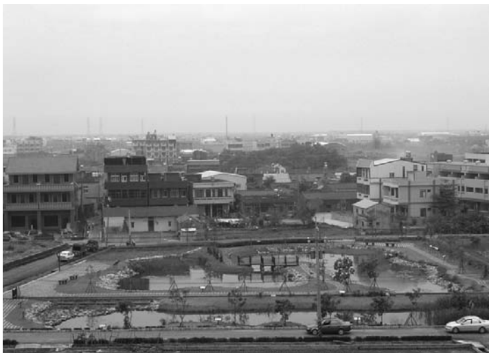
增設人工溼地生態池－社區污水水質淨化、地方教學及遊憩 (彰化縣鹿港鎮南勢區)

農地重劃自民國 47 年推動迄今 50 年，台閩地區辦理面積已逾 39 萬公頃，對於改善農業生產環境、擴大農場經營規模、提高農地生產力及加速農村基層建設等績效深深獲得農民肯定。農委會、內政部中部辦公室及內政部土地重劃工程局協助地方政府多與農民溝通規劃設計內容，以凝聚地方發展共識，因為農地重劃先期規劃作業做得好，施工實施就順利，計畫目標達成才有保障。未來辦理農地重劃之面積雖然不多，惟本著辦對及辦好農地重劃之原則，以落實營農環境及農村生活環境改善之目標。🌱