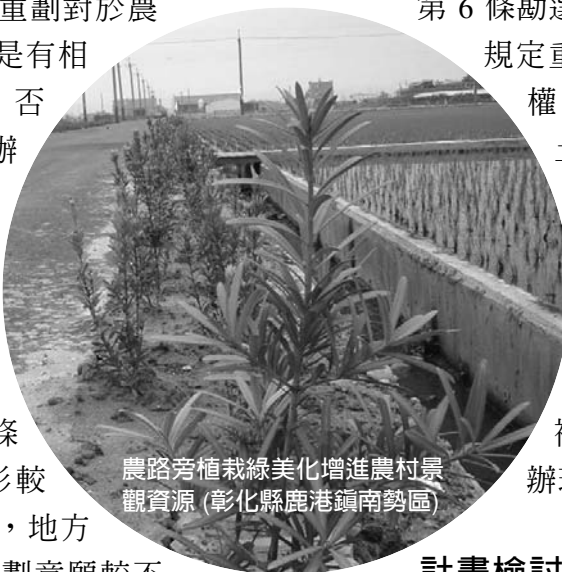
農路旁植栽綠美化增進農村景觀資源 (彰化縣鹿港鎮南勢區)

第 6 條勘選出重劃區，及第 8 條規定重劃區內私有土地所有權人過半數，而其所有土地面積超過區內私有土地總面積半數者之申請，直轄市或縣(市)主管機關得報經內政部核准後，仍由農委會編列計畫經費補助，以幫助有需要辦理地區之農民。