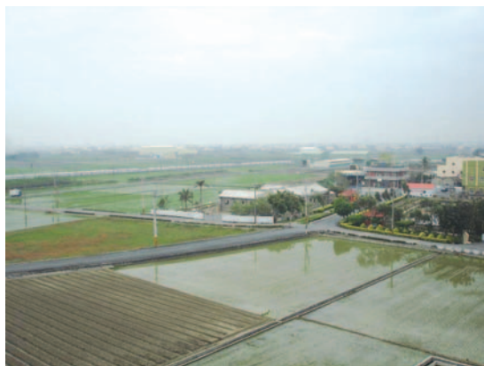
農地重劃後改善農村生活環境及坵塊臨水路及農路 (彰化縣鹿港鎮南勢區)

我國 91 年 1 月 1 日加入世界貿易組織 (WTO) 後，水稻生產面積有逐年調降趨勢，從 90 年 331,619 期作公頃，至 94 年 269,023 期作公頃（一期作 158,452 公頃，二期作 110,571 公頃），而過去農地重劃大多以水田模式辦理規劃設計，於是對於現行農地重劃計畫之推動，經建會提出下列質疑：（一）很多農地已經休耕、廢耕，再辦農地重劃整