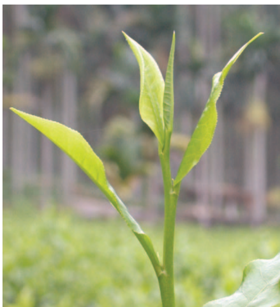
台茶 18 號茶芽