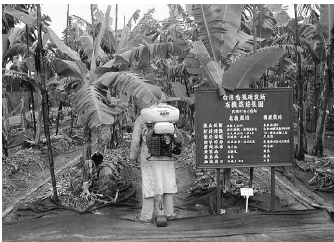
農民應對症下藥，千萬不可濫施化學藥劑

台灣香蕉產業已瀕臨存亡續絕之際；從 2005 年政府開放香蕉自由出口至今 2 年，不但未見出口數量的增加，反倒是有惡質台灣商人在日本對台灣香蕉進行惡意的中傷與扭曲而更