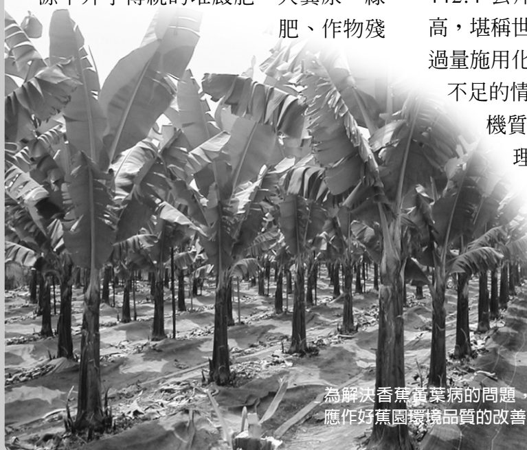
為解決香蕉黃葉病的問題，應作好蕉園環境品質的改善

機質含量全面明顯偏低，土壤物理化學及微生物性變劣，病蟲危害加據，地力衰退，農作物種植不易的結果。為保持農作收益，農民更盲目過量施用化學肥料以求提高產量，在無知的惡性循環下，3、40 年來，蕉農們始終因香蕉