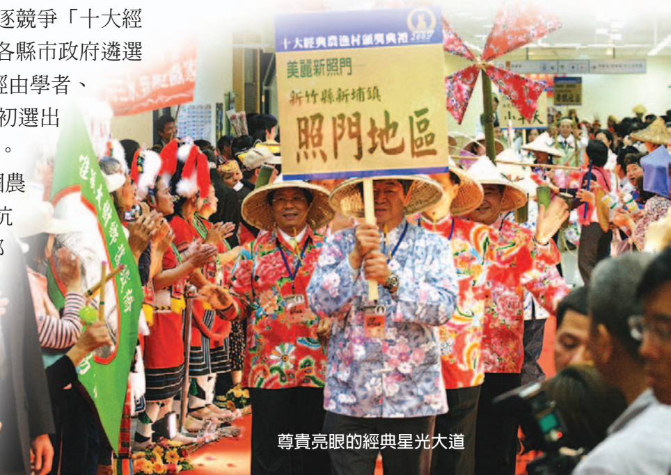
尊貴亮眼的經典星光大道

南投縣水里鄉上安村、苗栗縣大湖鄉栗林村薑麻園及三義鄉雙潭村雙潭地區、台東縣鹿野鄉永安社區、南投縣中寮鄉北中寮七村、高雄縣大樹鄉竹寮村舊鐵橋地區、苗栗縣通霄鎮福興社區、南投縣魚池鄉澀水社區、台南縣七股鄉溪南村、台北縣萬里磺潭村、花蓮縣瑞穗鄉舞鶴村、新竹縣新埔鎮照門地區、台南縣楠西鄉梅嶺地