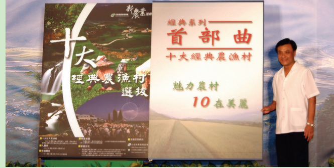
蘇主委翻開「經典系列選拔」巨著，首部曲「十大經典農漁村選拔」正式展開