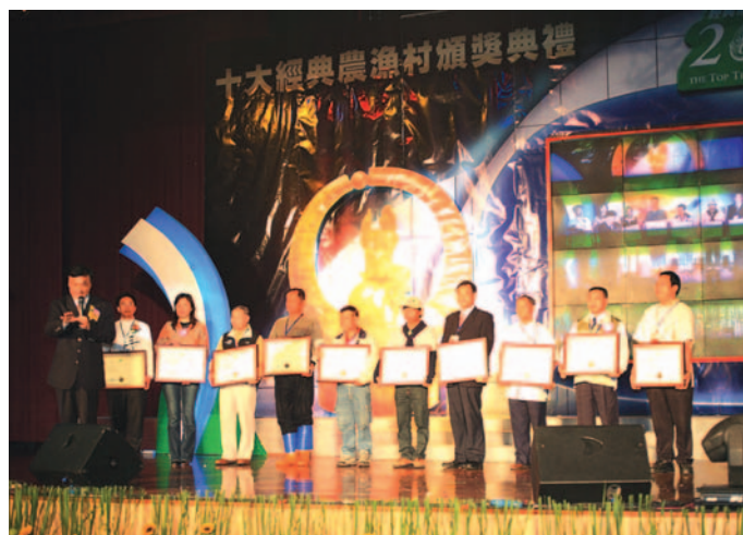
入圍農漁村也獲得高度的肯定