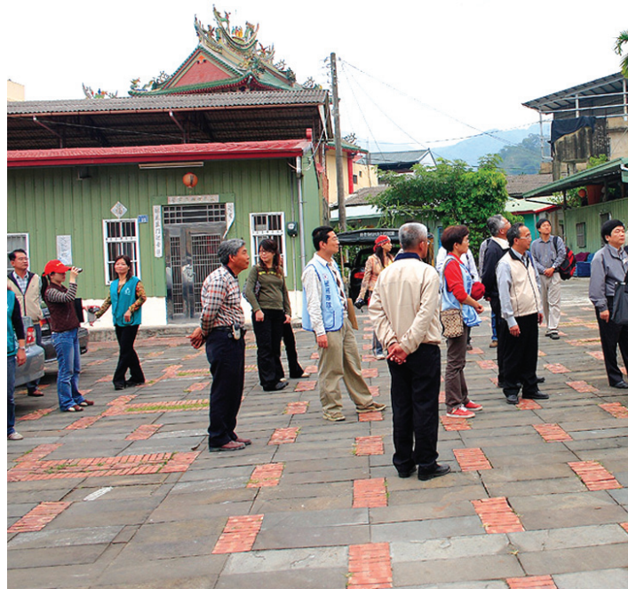
評審委員逐一現場實地查訪

獲得複選資格的20個農漁村分別是：雲林縣古坑鄉華山村、彰化縣田尾鄉打簾社區、桃園縣龍潭鄉三水村、嘉義縣梅山鄉太平社區、花蓮縣光復鄉馬太鞍地區、宜蘭縣蘇澳鎮港邊社區、花蓮縣富里鄉羅山村、