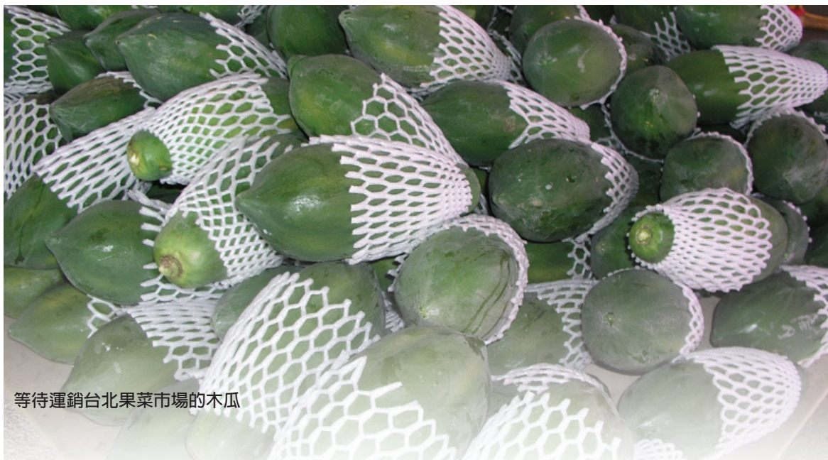
等待運銷台北果菜市場的木瓜

利用以往的豐沛人脈找來農試所專家為農民上課，在第一時間取得最新品種的作物種子，引導農民解決產銷與技術問題。