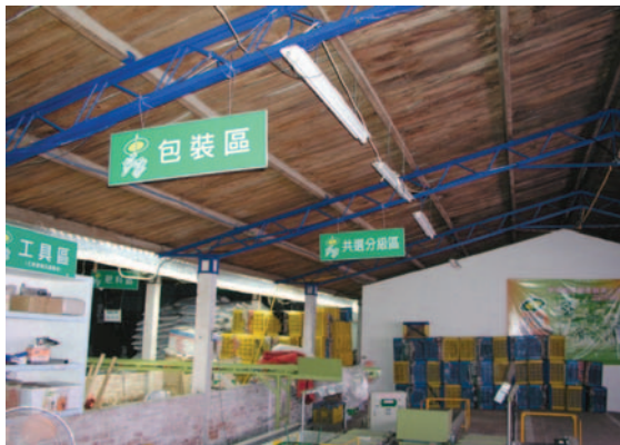
中埔鄉農會木瓜產銷分級包裝場