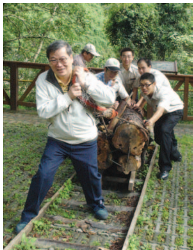
親自體驗古早伐木集運的辛苦

早期，林務局為了便利採伐及集運木材外出，乃自豐原直設森林鐵路至佳保台 (即八仙山森林遊樂區服務中心)，並於十文溪與佳保溪合流口地方，右側設有伏地索道，左側