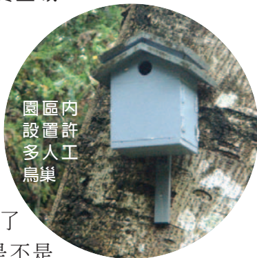
園區內設置許多人鳥巢

鳥兒的羽色相當漂亮，加上鳴唱的聲韻優雅，常淪落為人類的寵物，試想，如果森林少了這些山鳥鳴唱，是不是會很寂寞？八仙山四周群山環繞，森林蒼