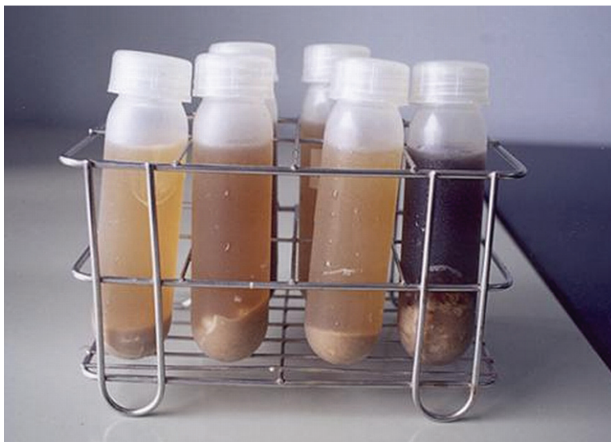
左邊 3 瓶為蛋白分解菌有效降解豆粉，右邊為不接菌處理仍殘留大量豆粉

有機液肥是從事有機農業農民所使用於養分補充的液體肥料，但它在病害防治與土壤肥力增進也逐漸受到國內外學者專家與從事有機農業農民的重視。在有機農耕的作法下，堆肥被當作主要的肥料，各型式的堆肥材料，有如發酵工業的廢棄物、造紙工業廢棄物等，因由於堆肥種類的不同，礦化程度也不盡相同，且釋放養分供作物利用的時期很難掌握，往往不能適時滿足作物養分的需求，有機液肥含有大量水分與有效養分，較施用固態堆肥更易被作物吸收利用。