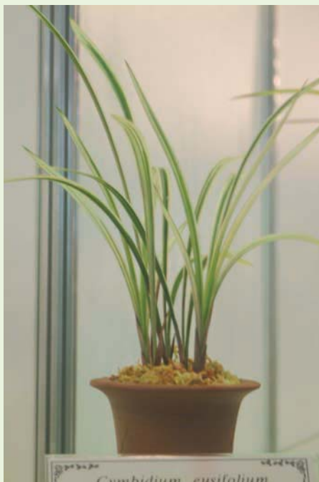
線條優美的國蘭盆栽廣受韓國各界喜愛

界有所謂的「金、銀、黑、白」術語，指的就是大陸報歲蘭系內的金華山、銀邊、山川、白墨，其他則有觀音素心、春蘭、玉華、大國、四季等；另一系統則為台灣原生報歲蘭系統，如瑞華、瑞寶、寶山等。栽培品種也隨著市場消費