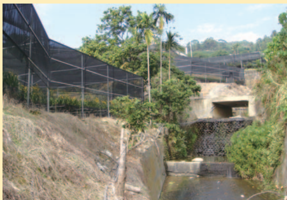
花園依地勢錯落而建