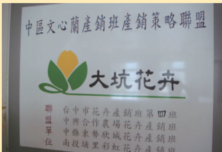
產銷班策略聯盟開創外銷佳績