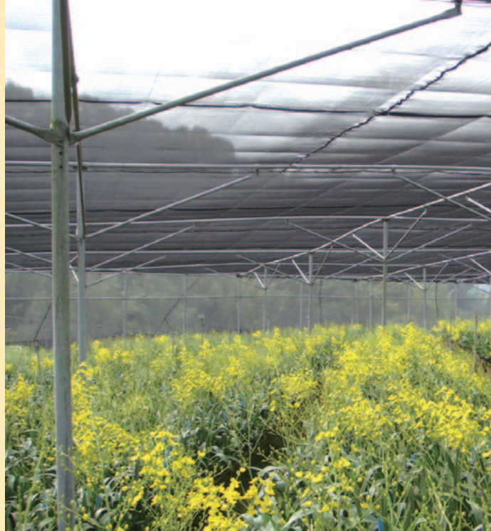
台中市花卉 4 班花園

台灣文心蘭專業栽培於 80 年代初始具規模，短短十多年時間，在海外打出一片江山，劉文華歸納台灣文心蘭的超強競