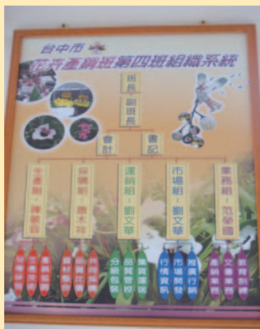
花卉 4 班組織分工表

約需 70 萬元，概算二番栽培周期長達 8 年，成本方能回收，相對於以前設施便宜、價格又好，運氣好時，約 2 年就可回收，風險已不可同日而語。