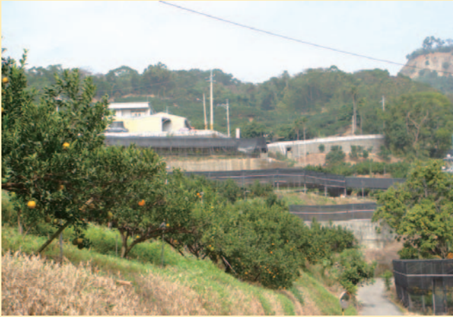
大坑是台中市後花園