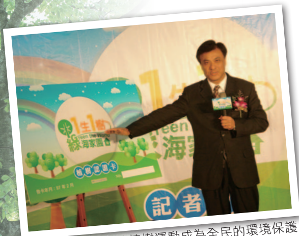
蘇主委致詞，期待植樹運動成為全民的環境保護運動

「你種樹了沒？」為了減緩全球暖化，農委會提出「一生一樹，綠海家園」計畫，希望未來 5 年內，全台至少有一半民眾能種下一棵樹，不只为保護地球盡一份力，更可为後代子孫留下豐富的資產。