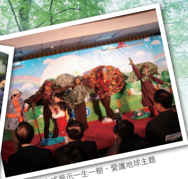
以行動表演方式揭示一生一樹，愛護地球主題

月)、楊梅(6月)、檫木(7月)、毛柿(8月)、月橘(9月)、台灣欒樹(10月)、楓香(11月)與無患子(12月)等12種「森日樹」，希望用森日與生日概念的轉化，串連民眾與森林的情感，鼓勵大眾對環境中的樹種有更多的認識，並提醒民眾能在立春適合種樹的時候，挑選屬於自己的森日樹種下，並能時時提醒自己照護所種植的樹木，讓種植、養護樹木變成生活中的一種習慣，讓「你種樹了沒？」成為彼