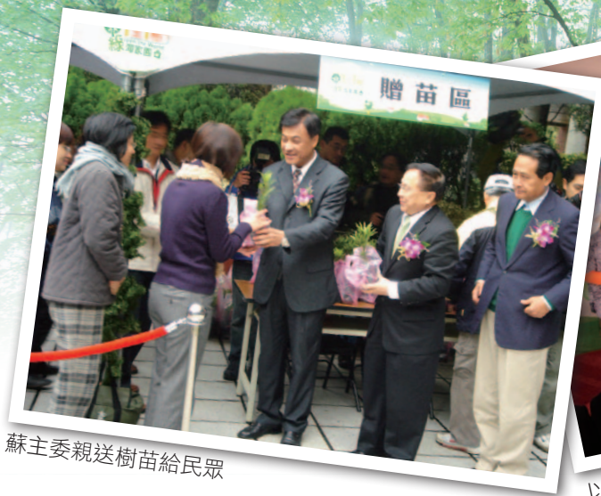
蘇主委親送樹苗給民眾