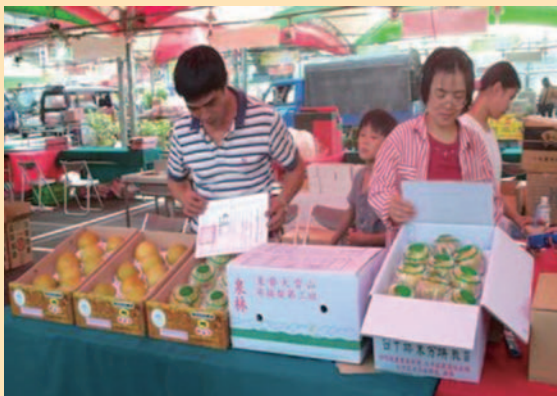
梨產銷 3 班參與展售會