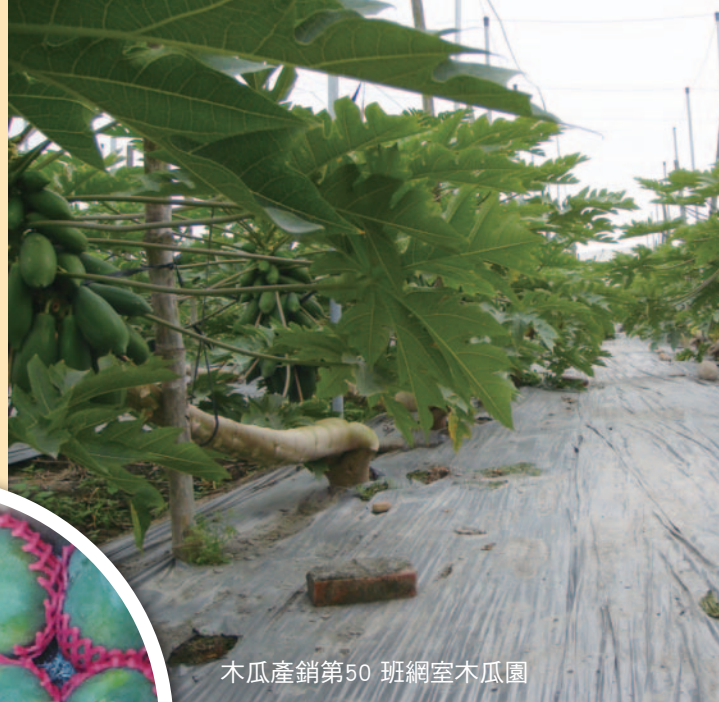
木瓜產銷第50班網室木瓜園

該班勤於學習新知，對於新穎的經營理念更是興致高昂，舉凡農業改良場等單位舉辦的栽培管理技術、土壤肥力檢定、安全用藥、有機施肥等教育訓練，以及各式觀摩講習會，班員莫不踴躍參與，在在顯現該班向上提升的努力，而導入歐盟