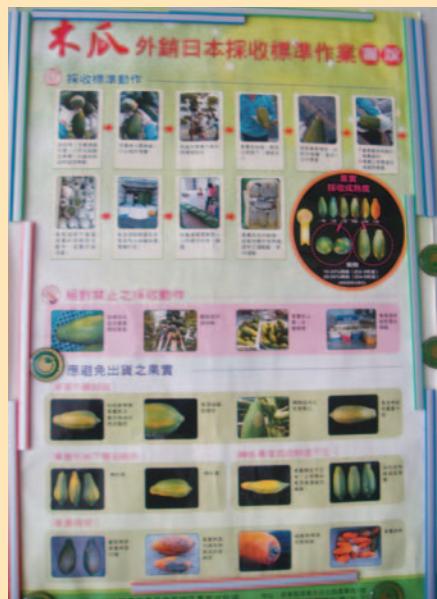
銷日木瓜採收作業標準作業圖

項設備，3 個示範班的主力作物木瓜、蓮霧、鳳梨經過層層關卡考核，96 年 8 月 14 日順利通過歐盟 GLOBALGAP 驗證，成為引領屏東縣優質水果迎向世界的先鋒部隊。