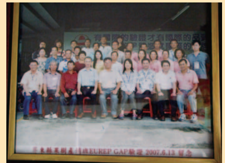
參與驗證果農合影留念