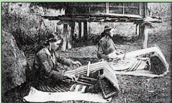
圖 2. 台灣賽夏族女子在倉庫前織布（宮本延人，1992）。倉庫支柱覆有防鼠板的特殊構造，從該照片無法估計賽夏族的歷史文化有多久，但從登呂遺址則能探本溯源，約在2000年前來自台灣