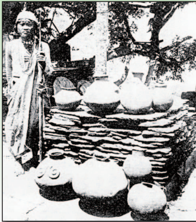
圖 4. 排灣族(通稱儼儼族)的祖先所留下來的土器。(宮本延人，1992)

家屋倉庫、女紅紡織等生活樣式是傳自台灣嗎？查證過去的文獻，2 千年前，在佐佐木高明的書中引述著名農學家天野元之助，指出於中國後漢桓帝（公元 147 - 167 年）稻作在華中普遍種植之前，有從華南直接傳到日本的可能性【註 25】。從登呂博物館中，復原的倉庫、住家建造型式及稻作遺址等來看，今確實所謂的華南即坐落於台灣，雖大出一般人意外，卻在農史研究者意料之內。