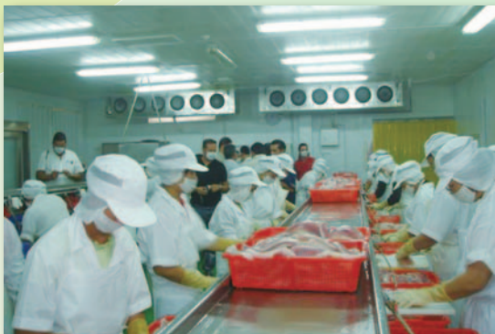
台灣鯛的魚鱗可提煉膠原蛋白