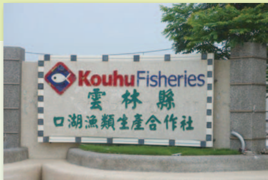
口湖漁類生產合作社是雲林縣唯一以台灣鯛為主的加工廠

將規模較大的養殖戶納入合作社魚貨供應來源，並實施「漁產品安全管理制度」，強化漁產品加工水準。