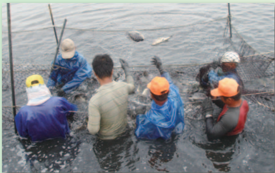
在技術精進下，台灣鯛躍升為養殖漁業的精品

口湖漁類生產合作社是雲林縣唯一以台灣鯛為主的加工廠，已通過國家精緻漁產「海宴」、國際漁產 HACCP 以及 CAS 優良食品認證，加工台灣鯛年產量達 4,500 - 7,000 公噸，以外銷美國及韓國為大宗。合作社與養殖業者採契作方式，