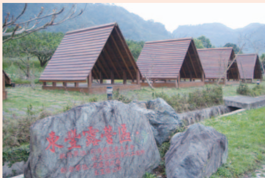
東豐社區營造小木屋露營區