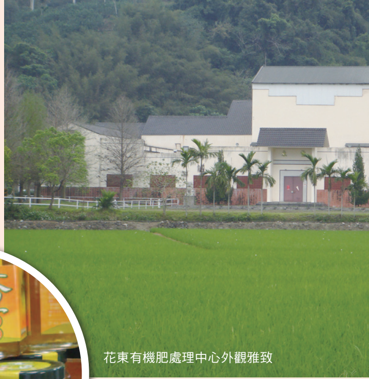
花東有機肥處理中心外觀雅致

產銷班「關係企業」花東有機肥處理中心，其建築體係敦聘專家精心規劃，白牆黑瓦的挑高設計，牆面鋪陳鏤空紅磚，門前巨型石獅坐鎮，寬廣前庭植栽美化，整體造型美輪美奐，與一般堆肥場多以鐵皮屋搭建而成的簡陋印象迥然不同，建築設計完全配合休閒農業走向。此外，其周邊還開闢步道引導訪客登高，眺望花東縱谷的秀麗山水。踏入東豐社區，處處可感受到居民迎客的熱忱。