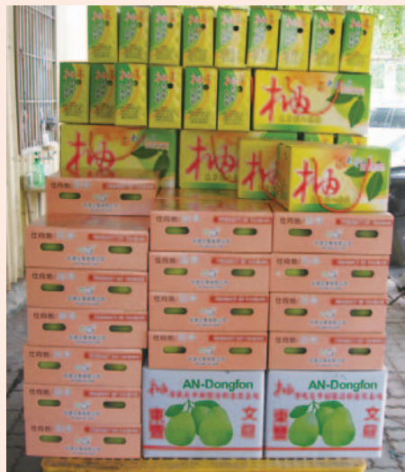
東豐文旦主攻直銷通路