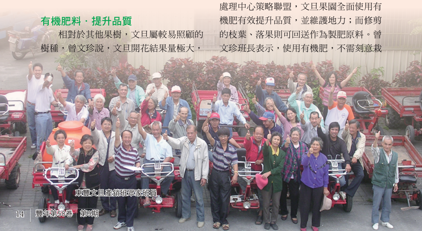
東豐文旦產銷班眾家班員