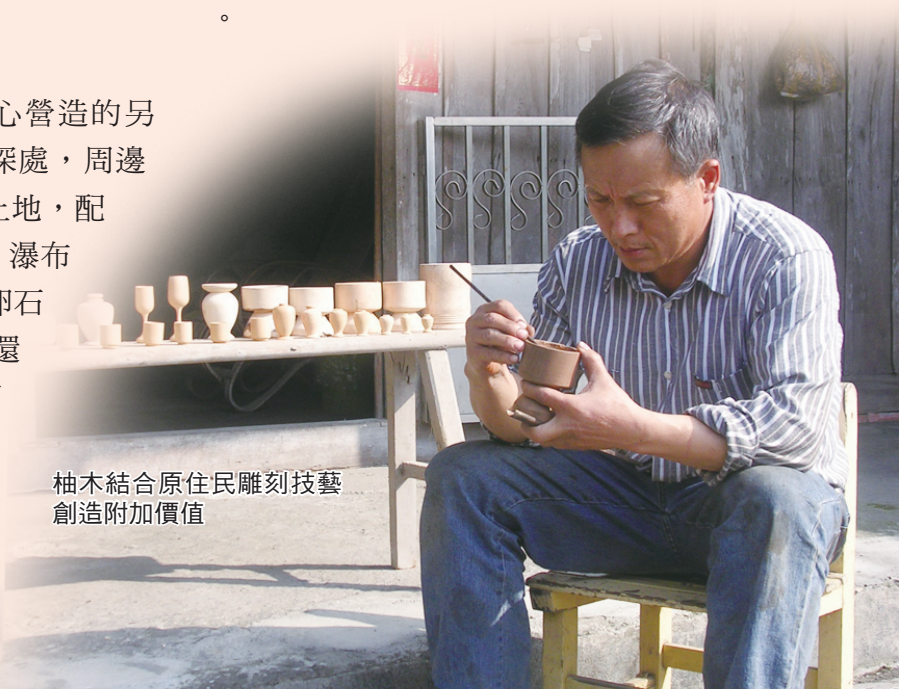
柚木結合原住民雕刻技藝 創造附加價值