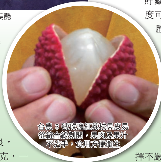
台農 3 號玫瑰紅荔枝果皮易從縫合線剝開，果肉及果汁不沾手，食用方便衛生

貯藏力強，在 5°C 的溫度可冷藏 1 個月，但為顧及一般冷藏箱或家庭用的冰箱，溫度的控制不是很穩定，因此建議冷藏時間最好不要超過 3 周。