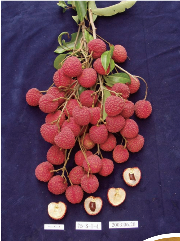
台農 3 號玫瑰紅荔枝果皮鮮紅美艷