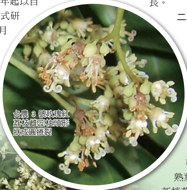
台農 3 號玫瑰紅 荔枝雌蕊柱頭形 狀成圓捲裂

育種，於民國 93 年成功的推出了「荔枝台農 1 號翠玉」之後，於 96 年再度推出另一新的品種－「台農 3 號玫瑰紅」。本品種從民國 75 年起以自然授粉實生選種的方式研發，至民國 96 年 3 月底正式取得品種權，前後共歷經了 21 年的努力。本品種取名為「玫瑰紅」的理由在於其果皮顏色如紅玫瑰般的