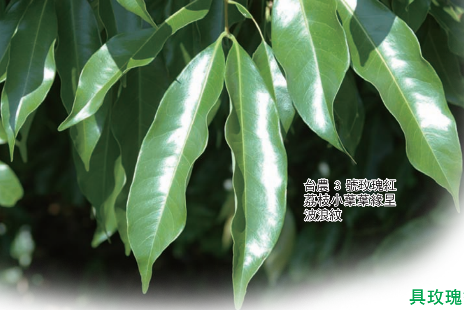
台農 3 號玫瑰紅 荔枝小葉葉緣呈 波浪紋

艷麗，且果肉具有玫瑰的特殊香味。有別於「荔枝台農 1 號翠玉」是中早熟種，本品種是晚熟種，希望這兩個品種的搭配，能更有效延長台灣荔枝的產期。