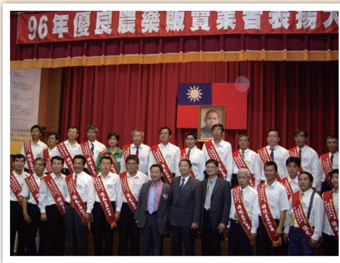
動植物防疫檢疫局於 96 年 12 月 11 日在南投縣政府舉辦「96 年優良農藥販賣業者表揚大會」

（六）農藥販賣業者應於其農藥管理人員任職或離職之日起 30 日內，報請其所在地直轄市或縣（市）主管機關備查。（第 16 條）