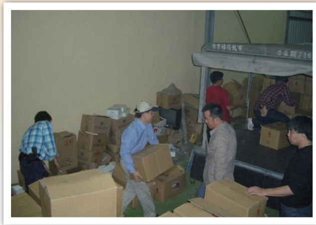
動植物防疫檢疫局人員與刑警隊刑警搬運查扣偽農藥上車情形