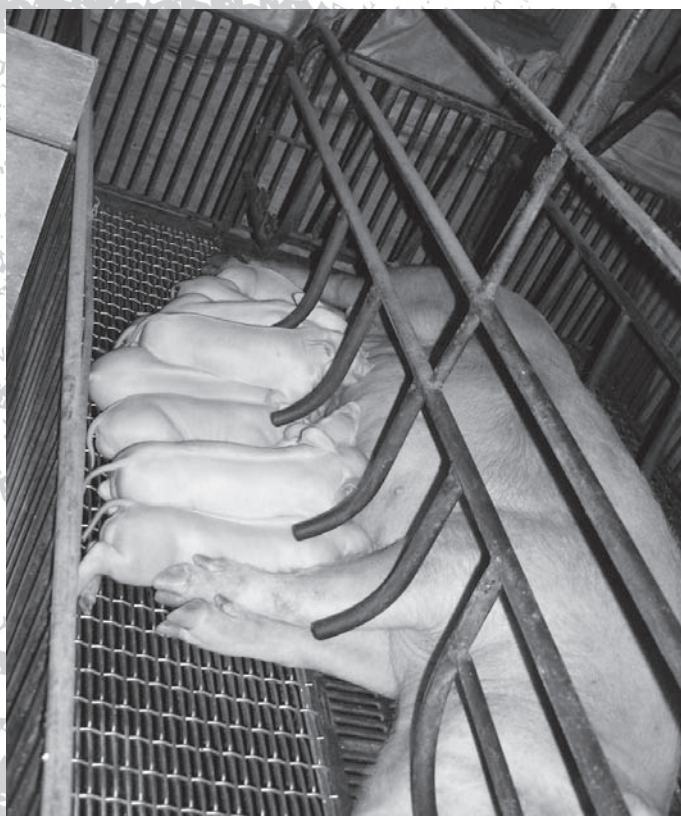
配種後 114 天豬母生出仔豬

當時因農業科技落後，對於豬哥精液品質如何並不知道，可能並不適合作為種用。早期「牽豬哥」是由阿伯驅趕著豬哥走到各村落尋歡，雖然村落和村