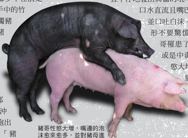
豬哥性慾大增，嘴邊的泡沫愈來愈多，並對豬母進行調情和挑逗