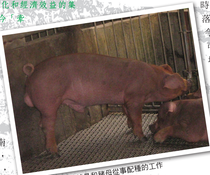
豬哥主要的任務就是和豬母從事配種的工作

，準備來個肉搏戰。此時，我們這群小孩的心情也會隨著竹笛聲愈來愈近而更高興，大家不約而同的從家中跑出來站在村落的田埂路上迎接豬哥的到來。小