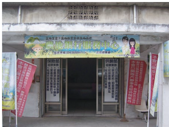
芳苑農會響應政策，開辦農地仲介服務