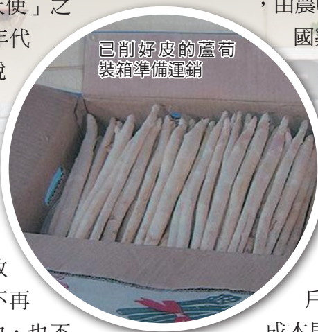
已削好皮的蘆筍 裝箱準備運銷

成功，部分農民於是在蘆筍田上興建雞舍，由農轉牧，如今芳苑鄉已晉身全國雞蛋最大產地，飼養蛋雞數達700多萬隻，雞蛋產量占全國供應量的30%。8、9年前，國內曾吹起一陣蛋塔風，當時雞蛋每台斤產地價格曾達28、29元，而每台斤成本不過12、13元，是養雞戶最風光的年代，如今飼料成本居高不下，農民收益已大不如前。謝總幹事說，芳苑農民看天吃飯，這廂農作不賺錢就轉型，有人成功，當然也有人失敗；辛苦耕耘仍拼不過大環境的變化，農民備感無奈。