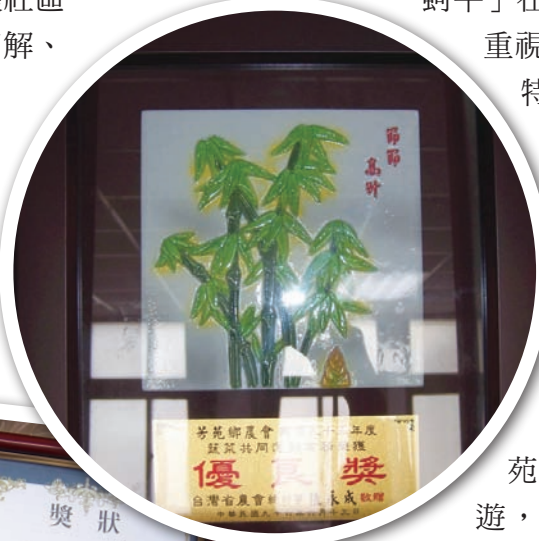
芳苑農會近年力圖振作、屢獲佳績

數農地屬砂質土壤，早期以種植蘆筍、花生等作物為主，其中蘆筍大多採契作方式，由貿易商收購、銷往國外，民國60、70年代是蘆筍的全盛時期。蘆筍含