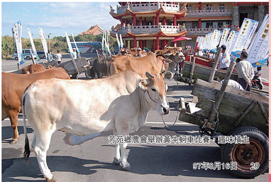
芳苑鄉農會舉辦黃牛蚵車比賽，趣味橫生

以供銷部來說，辦理肥料、稻穀服務到家，減少農民舟車奔波的不便；實施蔬菜共同運銷，減少中間剝削，保障農民所得，協助農民辦理汽車強制險、健保卡換領及老農津貼，希望藉由對農民貼心的服務，重拾農戶對於農會的信心。在推廣方面，芳苑鄉今年生產的洋蔥品質相當優良，謝總幹事為協助農民行銷，透過彰化縣