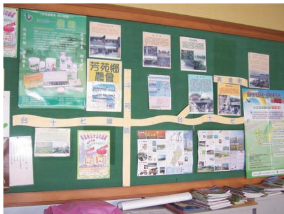
芳苑農會推廣股布告欄隨時公布最新活動訊息