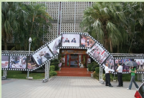
展場位於台大農業陳列館