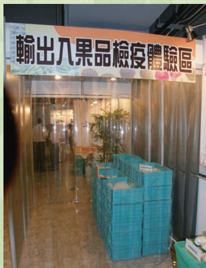
輸出入果品檢疫體驗區

這次展覽有許多相當有趣的地方，例如在二樓的國產電宰豬肉展區中，利用可愛的人偶模擬真人從事豬隻電宰，各個環節都按照真實作業環境的要求，相當逼真；另一方面，為了落實防疫檢疫教育向下紮根之目標，防檢局將基本常識與時下小朋友喜愛