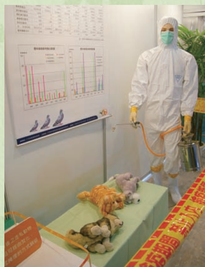
走私動物銷毀作業區