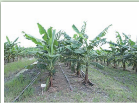
施肥試驗。左為對照區，右為增施鉀肥區