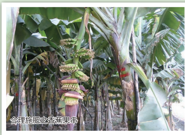
合理施肥之香蕉果串

合理肥料施用的原則是參考作物施肥手冊的推薦量，適量的補充供應土壤中植株所需的不足養分。土壤肥力分析可顯示土壤提供作物所需有效養分能力的基本訊息，以作為決定施肥量的參考依據。土壤肥力分析所提供的土壤酸鹼值對作物生長及養分有效性有重大的影響。規劃種植之蕉園在整地前應採取土壤樣本，委請農業試驗所、各改良場或台灣香蕉研究所進行分析（至少每隔 2 - 3 年，次）。蕉園土壤養分的臨界值如表 2 所示。