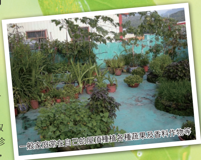
一般家庭常在自己的屋頂種植各種蔬果及香料作物等

在台灣如果想要住家周圍也有寬闊的草皮及花園，那你得先擠入豪門之列，或者擁有家族事業可以繼承或者擁有大面積的農地，也就是所謂的