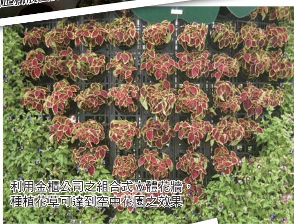
利用金櫃公司之組合式立體花牆，種植花草可達到空中花園之效果

一. 安全問題 ：如果在屋頂上要塔建立體栽培架或者是栽培植床，必須重視整體結構安全性，並事先考量颱風侵襲時該如何防範。另外，排水問題也應完善規劃，唯有