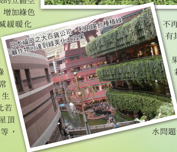
日本福岡之大百貨公司，利用陽台種植綠籬作物可達到綠美化之效果