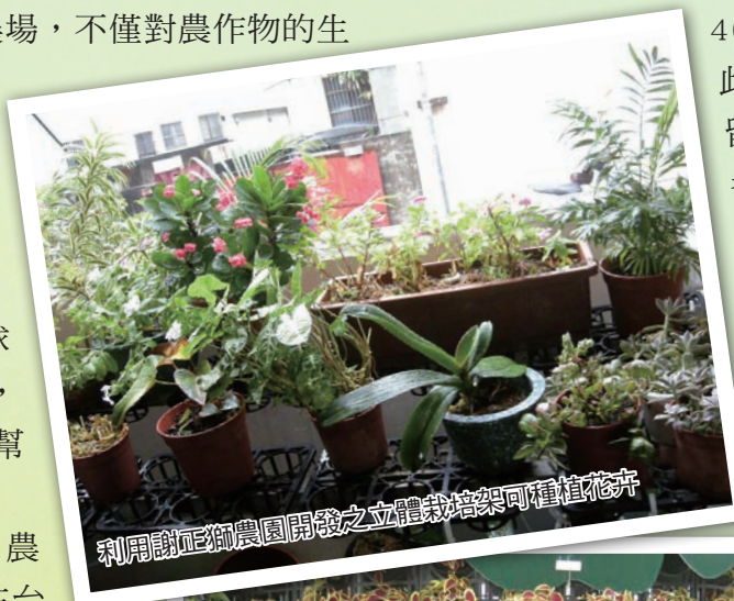
利用謝正獅農園開發之立體栽培架可種植花卉

直農場就是當地面上的土地被充分的利用後，改將目標轉向住宅大樓及各種建築物空間。通常這些建物容積率加起來占有相當大的面積，如能加以利用種植植物，甚至開發成農場，不僅對農作物的生產有幫助，將來若能全面實施，綠色植物的面積大幅增加，對於減緩地球暖化之效果，多少也有些幫助。