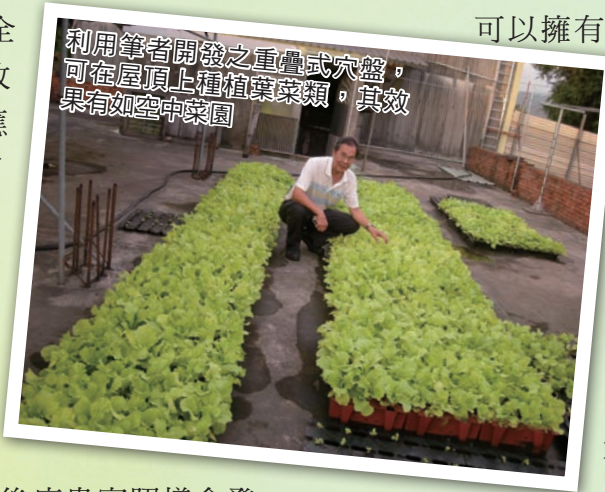
利用筆者開發之重疊式穴盤，可在屋頂上種植葉菜類，其效果有如空中菜園