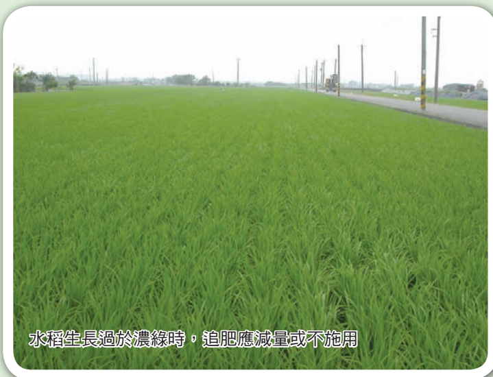
水稻生長過於濃綠時，追肥應減量或不施用

作用而使秧苗倒伏。其實第一個原因是農友們多慮了，因台灣第一期作與第二期作水稻生長環境迥異，病蟲害發生種類與頻度多不相同，稻草回歸土壤雖有可能使部分蟲害得以延續，但只要施肥合理，防制上並不困難；第二個原因則可在水稻插秧後即讓稻田漸次放乾，約於 4 - 5 天後土面水分消失，則原本漂浮於水中的稻草即與土面黏著，此時予以灌水，則稻草多已不會再漂浮，自然不會造成秧苗倒伏。