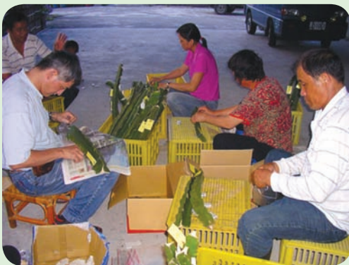
檢測紅龍果植株前之取樣情形

選出低病毒的紅龍果種苗，配合農具專屬專用的使用方式，可以抑制仙人掌病毒 X 的擴散蔓延，也可以防止外來病原菌的入侵，維持紅龍果的健康安全。農試所已將該檢測技術技轉給花蓮縣玉溪地區農會，建立紅龍果低病毒健康種苗園，積極生產紅龍果健康苗，以供農友更新已罹患病毒病之病株。更新後之果園除能增加果實產量外，還可以延續果園的壽命，增進果農的收益。豐