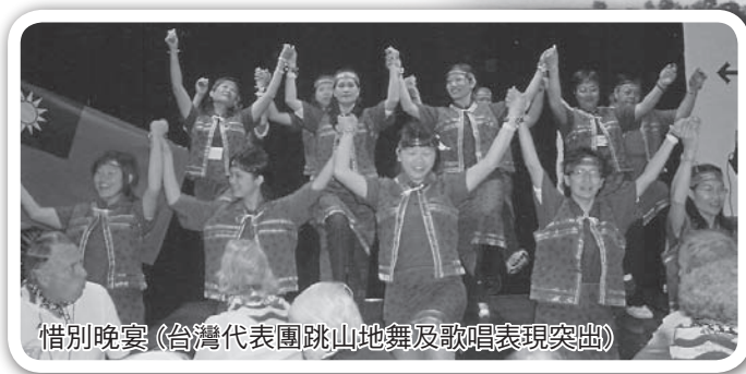
惜別晚宴(台灣代表團跳山地舞及歌唱表現突出)