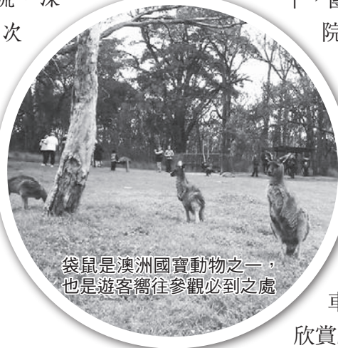
袋鼠是澳洲國寶動物之一，也是遊客嚮往參觀必到之處

5 年 1 次的第九屆世界農村青年交流會議 (World IFYE) 日前在澳洲的阿德雷德 (Adelaide) 舉辦。筆者有機會參與該次會議，藉此了解國際農村發展及農村青年之活動導向和農村狀況，並促進國際農村青年有更好的瞭解與交流，深感意義深遠。然而，本次大會各項活動，整體說來尚稱如意，唯因參訪地點分散，每次參訪耗費車程時間及奔波是美中不足之處，同時也感覺澳洲政府對 IFYE 之支持度熱心似乎不夠，有待加強輔導。