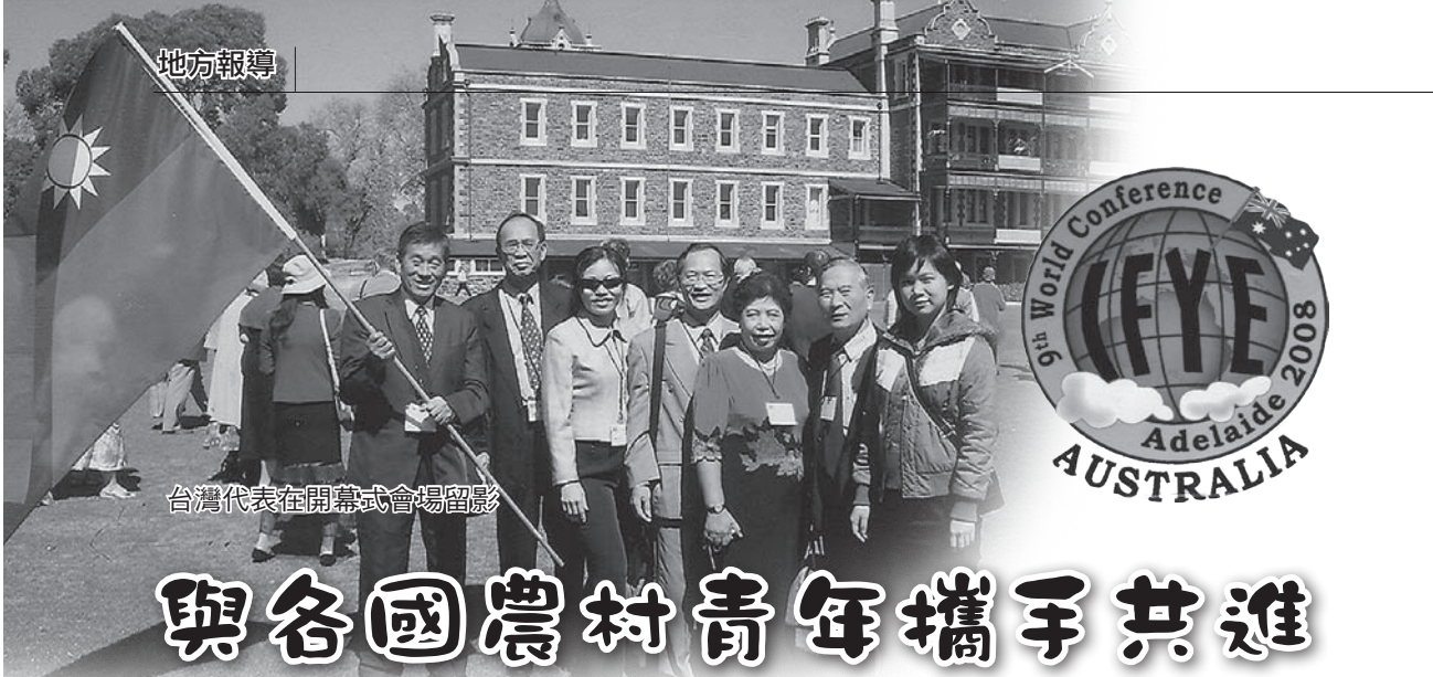
台灣代表在開幕式會場留影