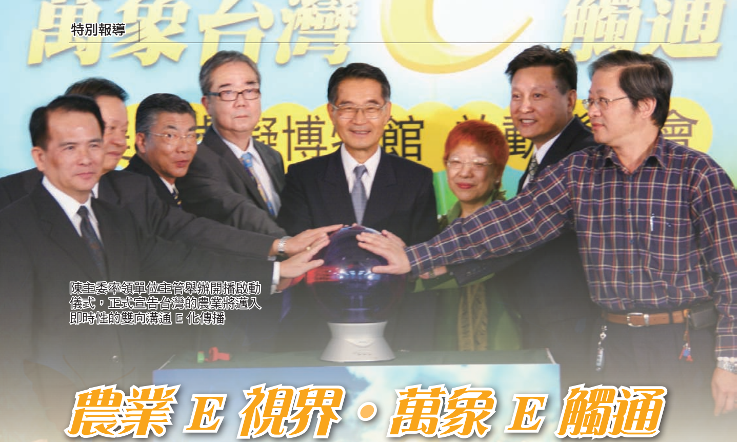
陳主委率領單位主管舉辦開播啟動儀式，正式宣告台灣的農業將邁入即時性的雙向溝通 E 化傳播