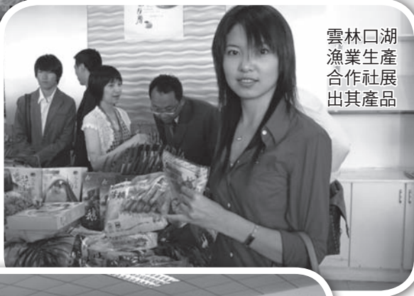
雲林口湖漁業生產合作社展出其產品