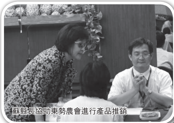
蘇縣長協助東勢農會進行產品推銷

自 2006 年起，縣府從協助農民進行病蟲危害管理，以性費洛蒙非化學防治方式，在雲林縣境全面展開，有效防止病蟲的危害。更也加強農民以省力、省工的