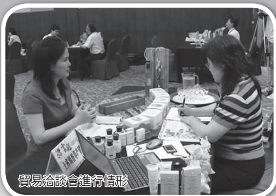
貿易洽談會進行情形

看過如此的政府帶領農民團體進行貿易工作，特別是縣長本人從頭到尾的參加，而且亦協助農民親自融入貿易洽談中，為推銷雲林農產品而努力。