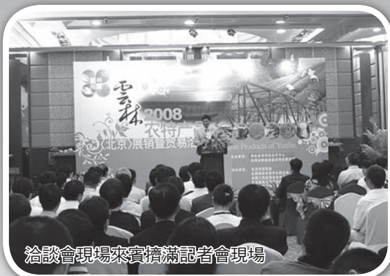
洽談會現場來賓擠滿記者會現場