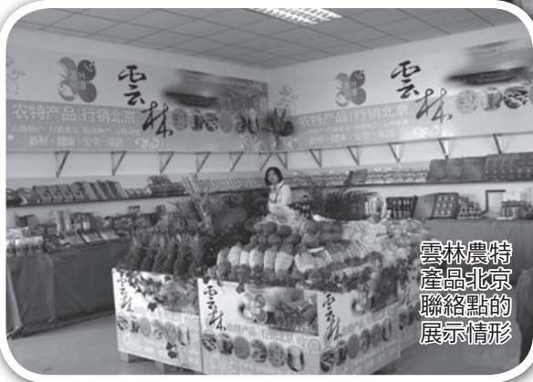
雲林農特產品北京聯絡點的展示情形