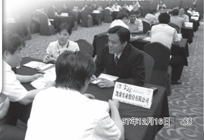
農民團體正在向貿易商介紹產品