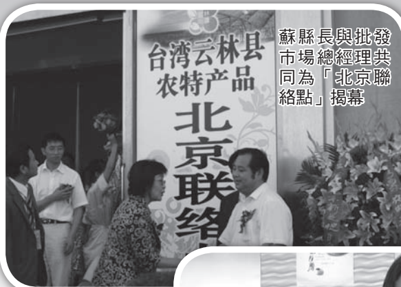
蘇縣長與批發市場總經理共同為「北京聯絡點」揭幕

此次，由縣長所帶領的近 45 位農民團體見證了雲林縣政府的努力與為農產品找出路的付出，縣府持著只要為農民有幫助，我們就去做的理念之下，帶著農民