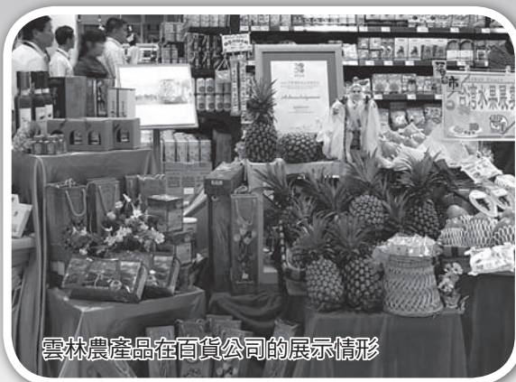
雲林農產品在百貨公司的展示情形

林內木瓜、土庫香草、荖桐黑肉田米、西螺醬油、雲林快樂豬等產品，在百貨公司中展出，均獲得許多的北京民眾喜愛與購買。