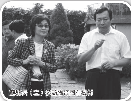
蘇縣長(左)參訪聯合國有機村