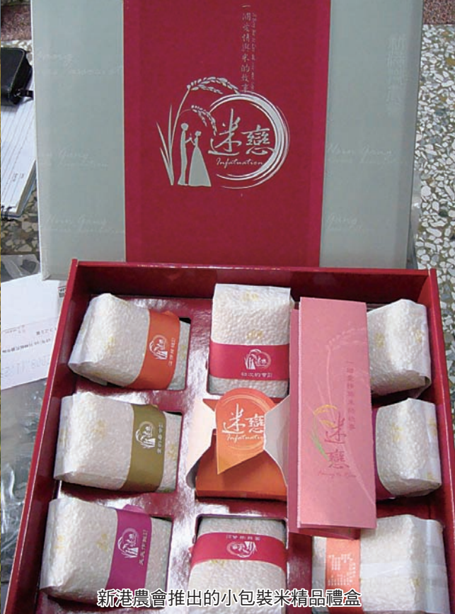
新港農會推出的小包裝米精品禮盒