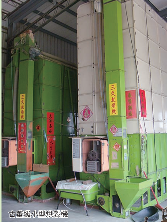
古董級小型烘穀機

耕作，土地需要休養喘口氣，深犁土壤，陽光可穿透底層消毒，深層土壤也可透氣，有助於根系伸展。