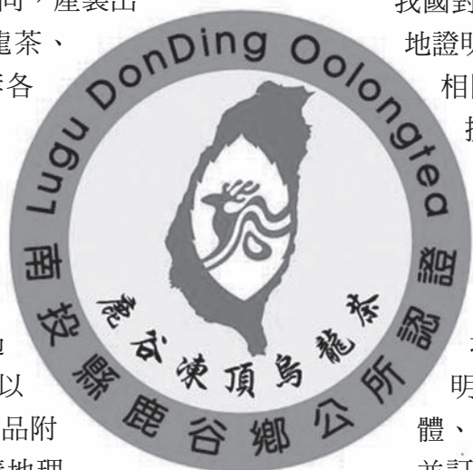
鹿谷凍頂烏龍茶標章圖示

茶為嗜好品。台灣各茶區因天然生產環境及茶葉製造方式不同，產製出文山包種茶、凍頂烏龍茶、東方美人茶、高山茶等各具特色及風味的茶葉。地理標示 (Geographical Indications) 係以地名取得註冊，並將其標示於商品上，彰顯其品質、信譽與價值，透過標章運用於產品行銷，以利消費者辨識，提高產品附加價值。因此，以申請地理標示作為台灣茶葉的行銷工具，不僅可提高茶農收益，亦可方便消費者選購，以確保其權益。