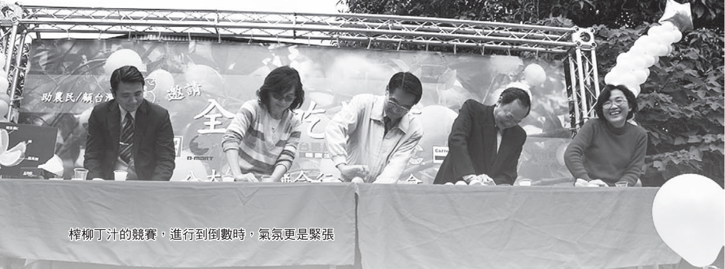
榨柳丁汁的競賽，進行到倒數時，氣氛更是緊張

人健康是衛生署的責任，因此，一定要向大家推薦柳丁。它的營養成分中有豐富的膳食纖維、維生素 A、B、C、磷、蘋果酸等，多吃柳丁不但能讓人美麗也能帶來健康，皮膚水噹噹不用說，喜歡美食的老饕享用後必讚不絕口。