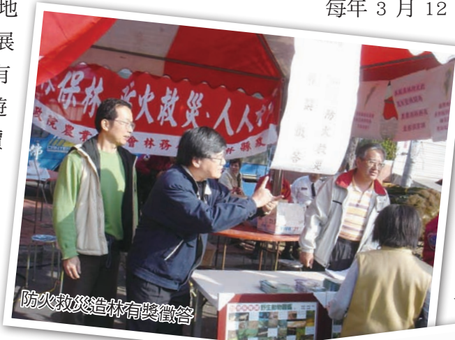
防火救災造林有獎徵答

蘇治芬縣長表示，為打造台灣成為綠色矽島與永續生態環境的夢想，一年一度的植樹月活動，在民眾心裡已留下深刻的印象，縣府希望藉由活動的舉辦，將愛林護林的理念傳達給全民，喚起縣民的共識，營造雲林縣優質的生活環境。種樹固然重要，後續維護工作更重要，樹木成長了，留給後代乘涼、庇蔭的處所，陪著國家的主人走向光明的未來，任重而道遠。🌳