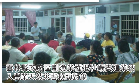
雲林縣政府區劃漁業權把牡蠣養殖業納入農業天然災害救助對象