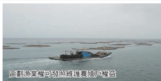
區劃漁業權可發照維護養殖戶權益

為全方位照顧漁民、振興農漁業，縣府並通過「雲林縣舢舨漁筏兼營娛樂漁業管理自治條例」，同意申請核准的舢舨漁筏兼營娛樂漁業，將結合外傘頂洲發展沿海觀光產業，讓對生態環境友善的無煙囱工業進駐雲林！