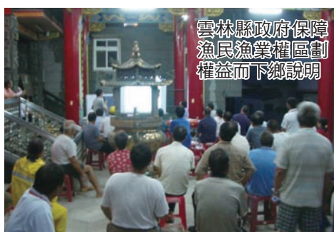
雲林縣政府保障漁民漁業權區劃權益而下鄉說明

以牡蠣養殖戶而言，屆時工業區建廠時，養殖戶就能獲得拆遷補償費，幫助資金短缺的漁民度過難關，而漁業科也將輔