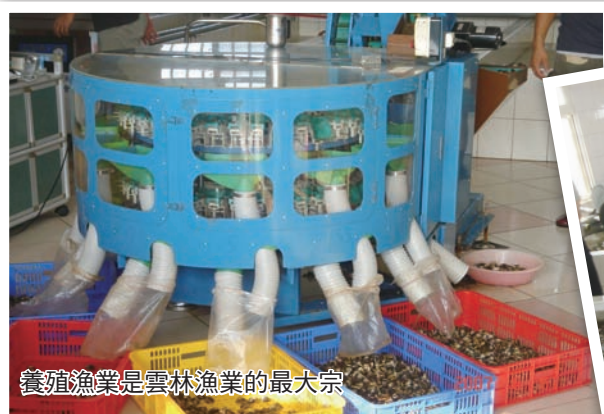
養殖漁業是雲林漁業的最大宗

牡蠣養殖業是雲林縣的漁業大宗，但目前中央政府決定在台西鄉海濱設立工業區，一旦填海興建工業區、設置廠房，養殖戶勢必得拆遷，生計大受影響，漁業權的區劃在此時顯得格外重要，災損救助、拆遷補償費都得仰賴它。