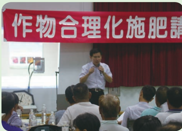
化學肥料價格高漲，農民應力行合理化施肥以節省施肥成本，圖為高雄區農業改良場宣導作物合理化施肥情形

近期因化學肥料價格高漲，農委會指示各區農業改良場組成「合理化施肥輔導小組」，辦理合理化施肥宣導講習，免費協助農民辦理土壤肥力檢測與作物需肥診斷服務，使農民有效使用化學肥料，減少用量降低成本。基於國內農民普遍使用化學肥料超量約 30%，高雄區農業改良場大力宣導轄區內重要作物之合理化施肥，以避免農民過度施用化學肥料所造成的土壤酸化、肥效降低以及成本提高情形，玉荷包荔枝由於有果肉細緻、糖分高、焦核，生長勢強等諸多優點，於高屏地區栽種面積逐年增加。土壤為供應植物養分最大的來源，土壤理化性質與施肥有很大的相