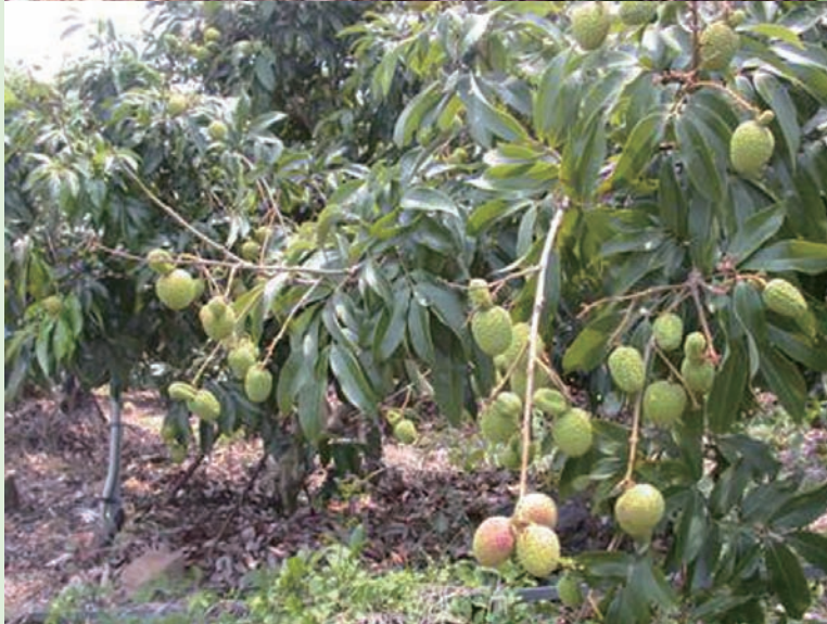
上圖為農民慣行區，下圖為合理化施肥區，兩區果長、果寬、果重及產量之差異不大，但合理化施肥區果實糖度可高約 1°Brix，且合理化施肥區較農民慣行施肥區化學肥料施用量較低

有效性鈣 66 毫克/公斤，有效性鎂 32 毫克/公斤，鐵 21 毫克/公斤，錳 23 毫克/公斤，銅 5.3 毫克/公斤，鋅 10 毫克/公斤，電導度 0.27 mmhos/cm。經說明如下，有機質含量 0.69%，土壤有效性磷太低，有效性鉀充足，有效性鈣及鎂不足，微量元素鐵、銅及鋅不足。經土壤速測結果肥料施用量之推薦如下，因土壤酸度過高，應施用 100 公斤/分地之苦土石灰；有機質含量太低（應大於 2%），應施用腐熟堆肥 800 公斤/分地；而三要素肥料推薦量如下，以自配化學肥料施用時硫酸銨施用 100 公斤（約 2.5 包）/年/分地，過磷酸鈣 155 公斤（約 4 包）/年/分地；氯化鉀 47 公斤（約 1.2 包）/年/分地，7 月施用硫酸銨總量的 50%，過磷酸鈣 50%，氯化鉀 40%，淺耕施用後