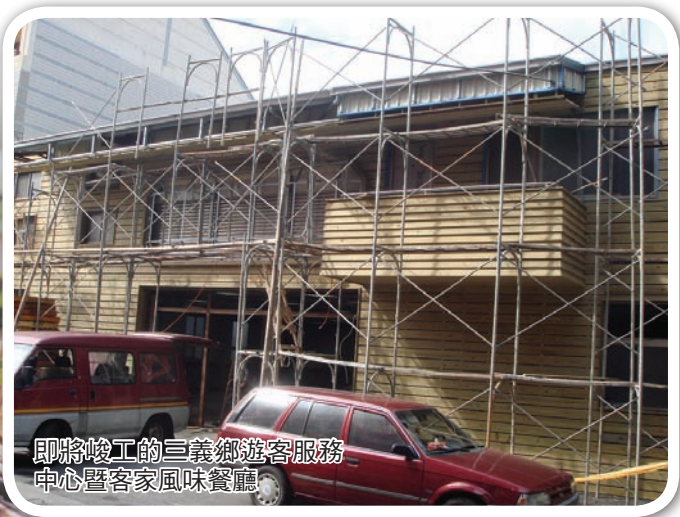
即將竣工的三義鄉遊客服務中心暨客家風味餐廳