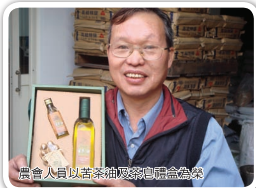
農會人員以苦茶油及茶自禮盒為榮

台灣的氣候型態大致以大安溪為南北分界線，三義鄉正好位於分界線上，是冬季季風的南界，因此鄉內天氣複雜多變，冬、春兩季更為明顯，經常出現「四時皆夏，一雨成秋」情形。過去，每年 11 月至翌年 3 月，無論白天或晚上，總是濃霧籠罩，而有「台灣的霧都」美譽，令人宛如置身虛