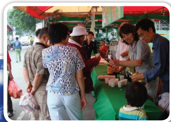
農會舉辦活動促銷農特產品與客家美食