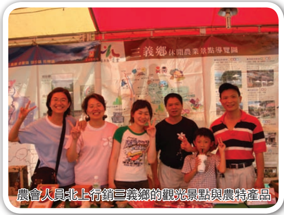
農會人員北上行銷三義鄉的觀光景點與農特產品