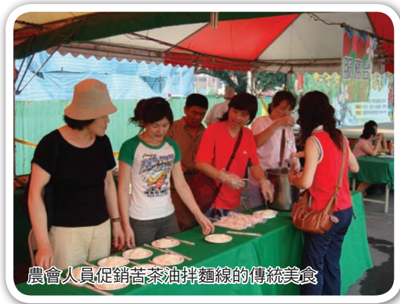
農會人員促銷苦茶油拌麵線的傳統美食