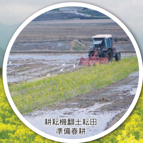
耕耘機翻土耘田 準備春耕