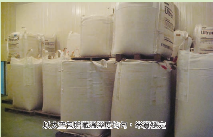
以太空包貯藏溫溼度均勻，米質穩定