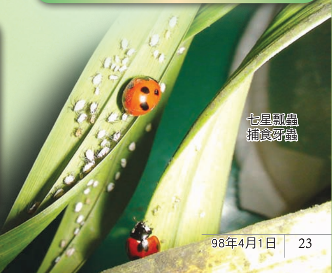
七星瓢蟲 捕食牙蟲