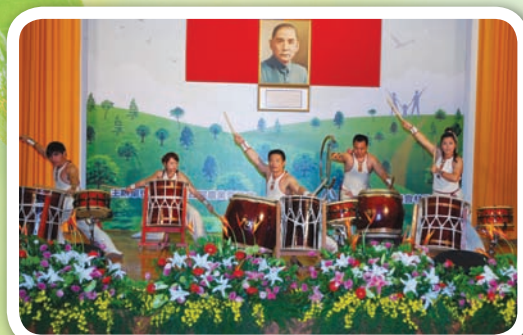
會中所穿插的表演節目，皆是由林務局及所屬單位同仁擔綱演出，其專業台風與精采絕倫程度毫不遜色

五葉松、羅漢松、龍柏等樹種，整個活動在國家文官培訓所 160 多位學員歡樂種下杜鵑樹苗後，活動順利圓滿結束。