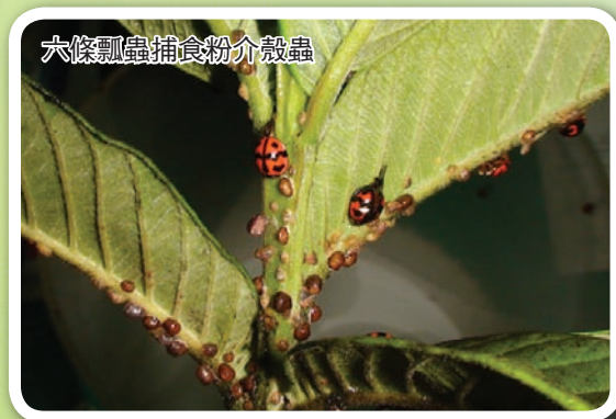
六條瓢蟲捕食粉介殼蟲