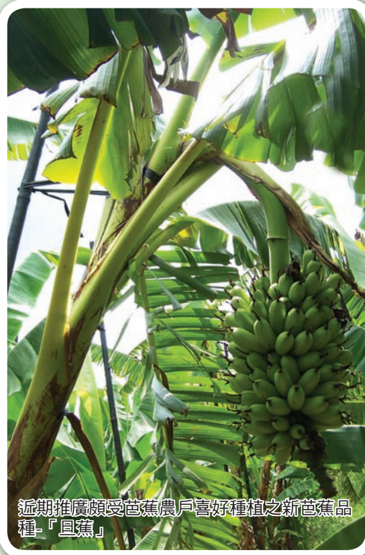
近期推廣頗受芭蕉農戶喜好種植之新芭蕉品種「具蕉」