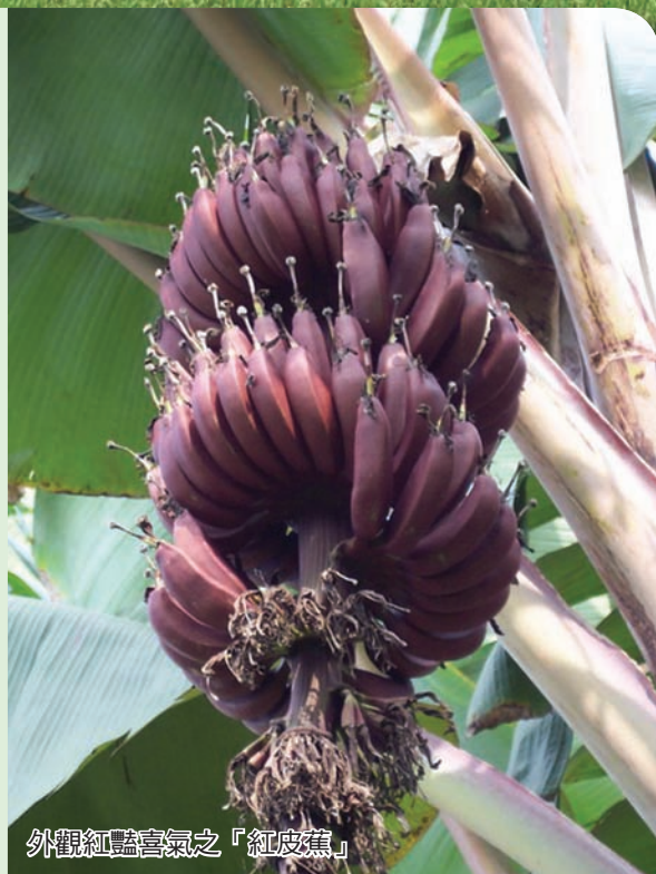
外觀紅豔喜氣之「紅皮蕉」

合理化芭蕉施肥管理的第一步驟是進行蕉園土壤肥力分析。芭蕉園在整地前應採取土壤樣本，委請農業試驗改良場或台灣香蕉研究所進行分析服務，至少每隔 2 - 3 年 1 次。土壤肥力分析可揭示土壤在提供作物所需有效養分能力上的基本訊息，配合蕉園土壤養分臨界值 (表 1)，作為芭蕉園土壤管理和施肥量決定的依據。土壤的交換性鉀含量和酸鹼值為肥力分析的重要訊息，前者影響芭蕉的產量、風味品質及抗病性，後者和作物的生長條件及養分有效性有重大的關係。