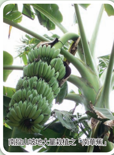
南投山坡地大量栽植之「南華蕉」