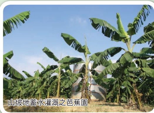
山坡地蓄水灌溉之芭蕉園