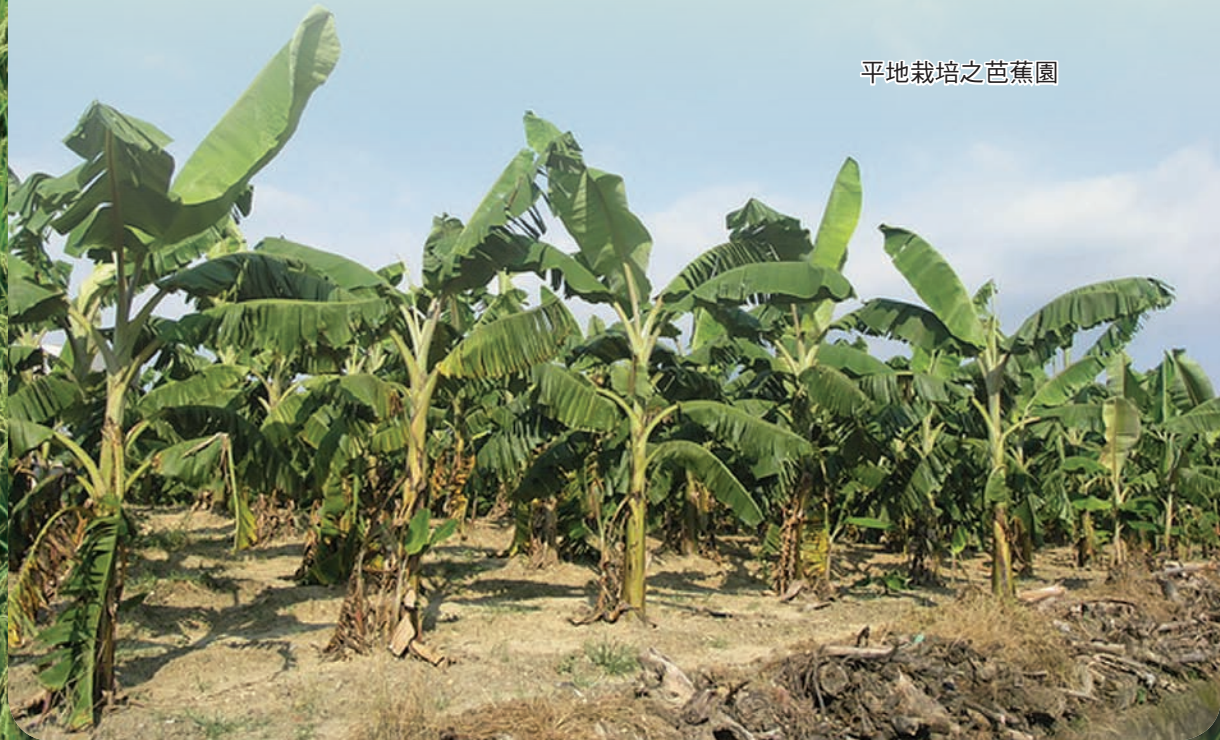
平地栽培之芭蕉園

近年來，在政府鼓勵推動休閒農業及農產品市場多樣化的風潮下，各鄉鎮紛紛採取「一鄉鎮一特產」、少量多樣化、鄉土化的策略，藉以帶動地方觀光旅遊業。因此，國內芭蕉的