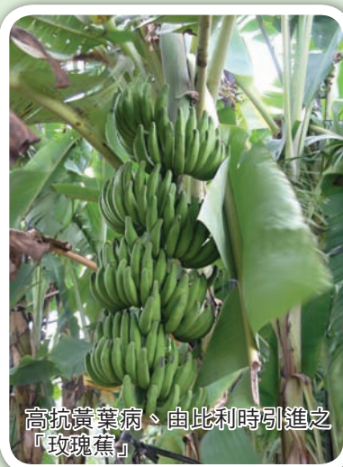
高抗黃葉病、由比利時引進之「玫瑰蕉」

3. 施肥種類：在一般正常土壤的蕉園中，只施用特 4 號複合肥料 (11-5.5-22) 即可，施用單質肥料時，三要素