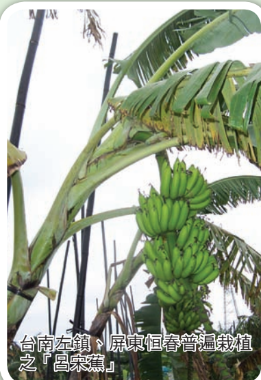
台南左鎮、屏東恒春普遍栽植之「呂宋蕉」

(氮-磷鉀-氧化鉀) 的比例可在 2-1-4 至 2-1-6 之間調配，以尿素、硫酸銨、過磷酸石灰 (鈣)、氯化鉀為主。