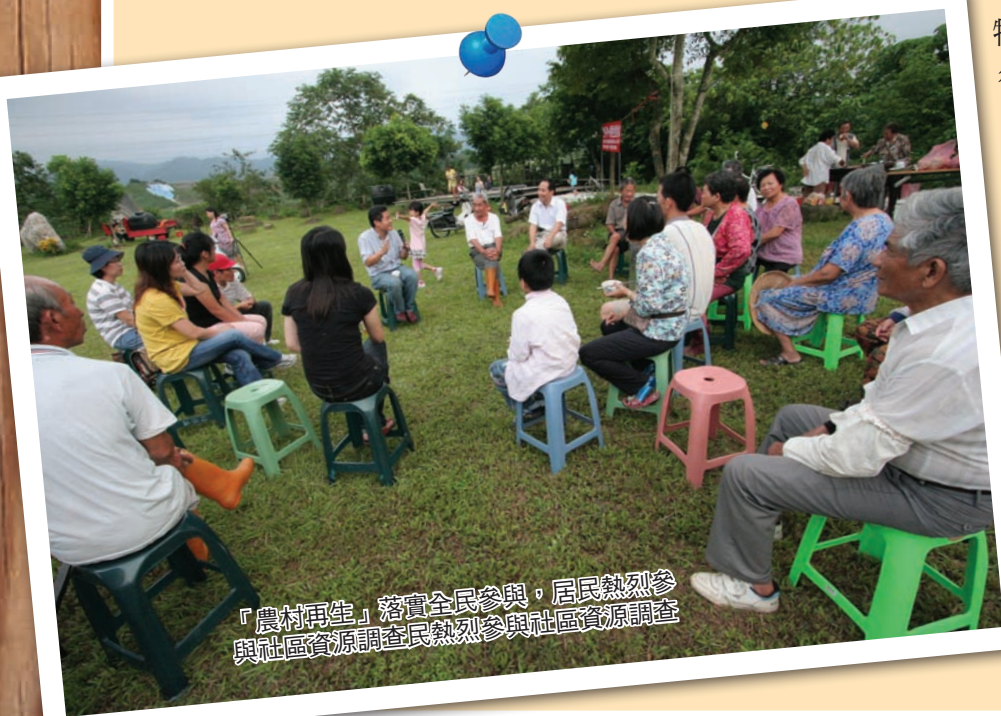
「農村再生」落實全民參與，居民熱烈參與社區資源調查

發展地方的優勢特色；台南後壁後廊村，將社區內老舊及閒置的空間賦予新的機能與生命，帶領民眾能以親身體驗的方式深入了解「無米樂」的田園趣味；...等。民眾可利用假期到農村感受獨有的靜謐。