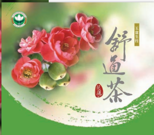
寒梅盛開的花朵， 型態富貴