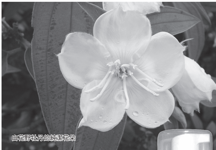
白花野牡丹的純潔花朵

效，近期更著手進行寒梅果實之相關保健產品研發計畫，利用其果實及枝、葉，配合數味中藥如台灣當歸、熟地、黃耆、川芎、伸筋草等，成功研製成寒梅保健茶包及飲品各一種，取名為「舒通茶」及「力達旺」。