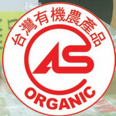
國產有機農產品標章

我國「有機農產品」管理新制自 98 年 1 月 31 日起實施，其中標示檢查部分，基於國際經貿及實際業務運作，至 8 月 1 日全面執行，屆期如有違反標示規定之產品，將依法查處。