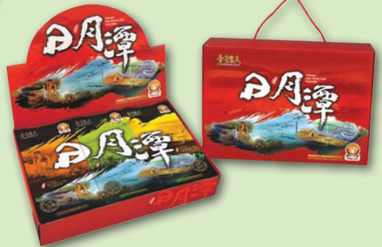
日月潭國際知名度高，是最佳招牌