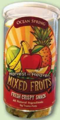
千紅農場加工乾燥蔬果打進美國有機商店