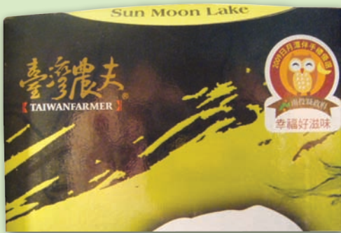
日月潭農產運銷合作社主打「台灣農夫」品牌