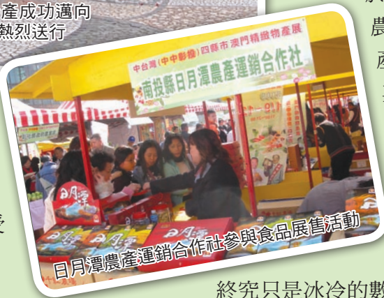
日月潭農產運銷合作社參與食品展售活動