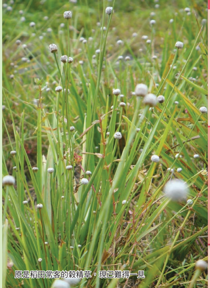
原是稻田常客的穀精草，現已難得一見