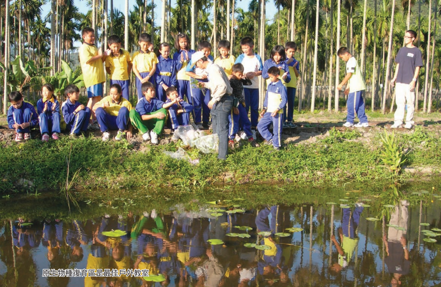
原生物種復育區是最佳戶外教室

四周群山拱繞、地形封閉，早年盆地也是一斛碧波綠水，在地人稱為「日潭」，後來湖水乾涸，成為形勢完整的平坦盆地。