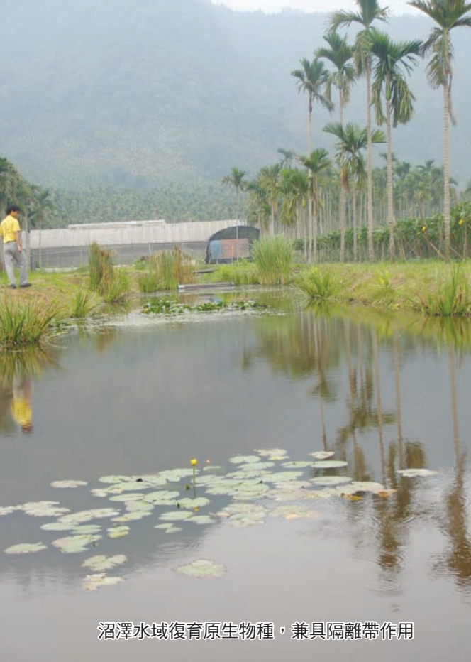
沼澤水域復育原生物種，兼具隔離帶作用