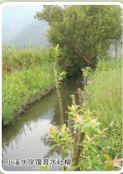
小溪水岸復育水社柳