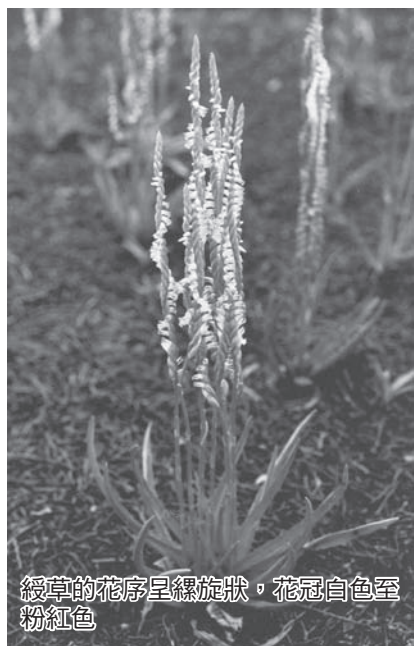
綬草的花序呈螺旋狀，花冠白色至粉紅色

綬草為藥用植物，花蓮區農業改良場經多年的研究，已開發建立綬草繁殖栽培模式，可大量繁殖和生產種苗，並已將此項栽培技術移轉給民間業者。